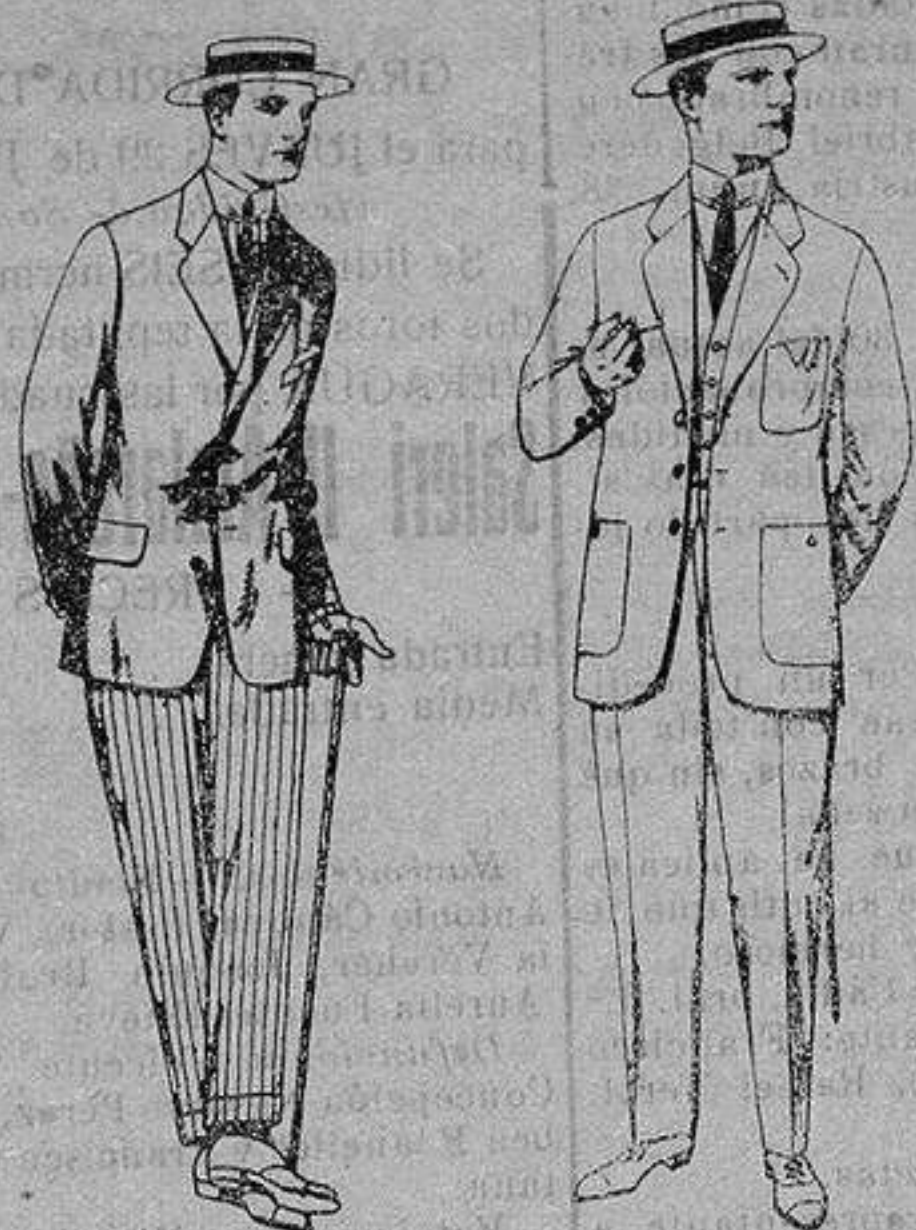
Trajes de alpaca negra De ptas. 32 a 50 Trajes de dril crudo o kaki De ptas. 10 a 35