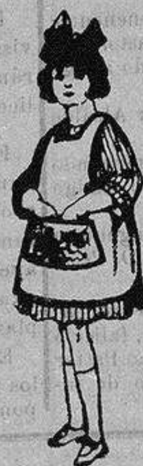
Delantal de dril color bodge. De ptas. 8 a 7

Precio Fijo - Ventas al contado Pídase el Catálogo General