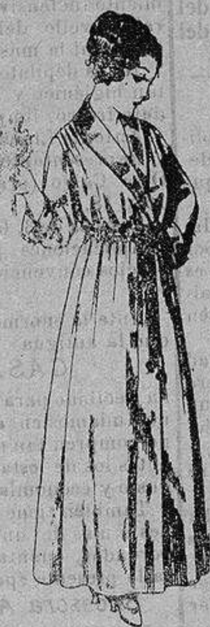
Bata crspon colores varios, cuello y boca-manga seda. De ptas. 15 a 20