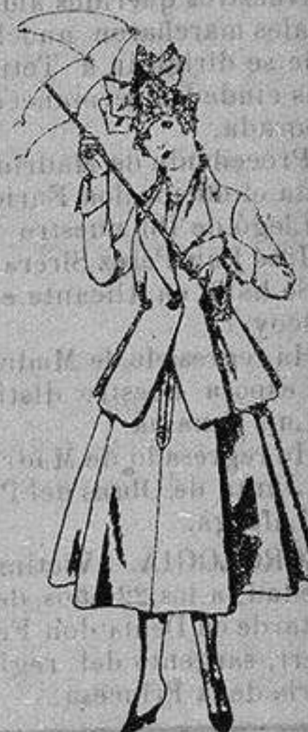
Trajes de lanilla negra azul y color, para jovencitas de 13 a 16 años. De ptas. 50 a 55