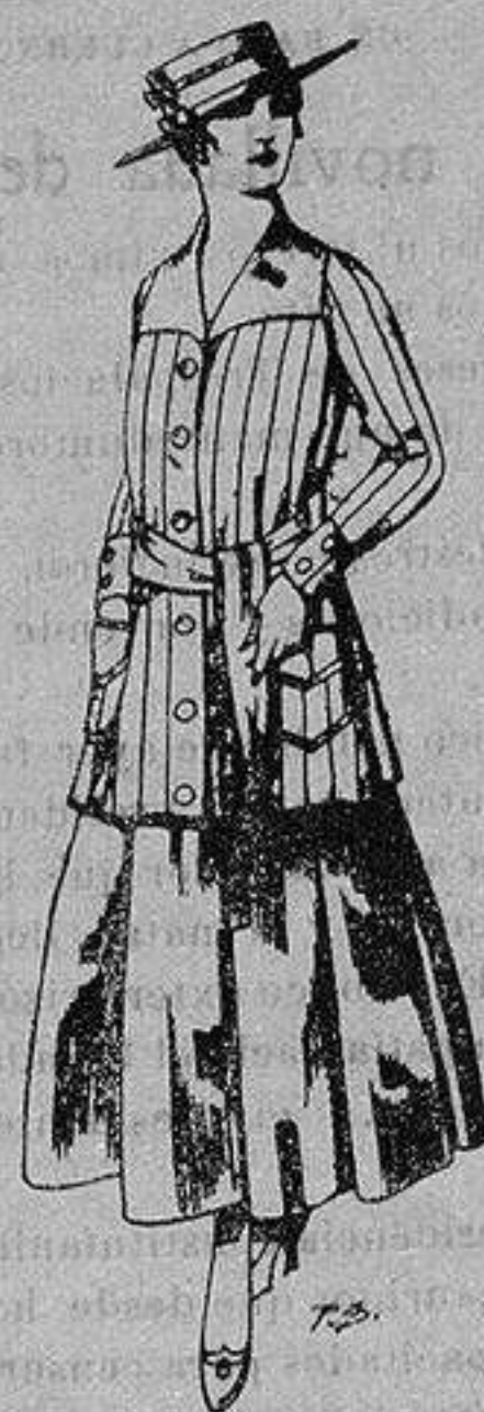
Paletot de tricof de seda colores lisos A ptas. 39