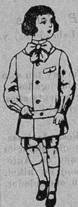
Trajes de lanilla en colores para niños de 4 a 9 años. De ptas. 9 a 18

Ropas confeccionadas para Caballero, Señora, Niño y Niña