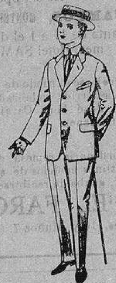
Trajes de lanilla, vicuña, etc. para juven-citos de 15 a 16 años. De ptas. 17 a 48