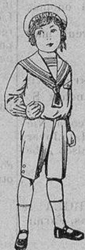
Trajes marinera de vicuña azul para niños de 4 a 9 años. De ptas. 6 a 20