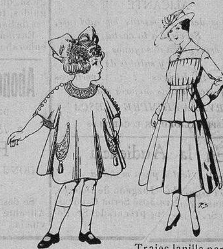
Vestidos de lanilla para niñas de 4 a 9 años De ptas. 30 a 38. Trajes lanilla para jovencitas de 13 a 16 años. De ptas. 50 a 55

Camisería, Géneros de Punto, Corbatería, Guantería, Sombrerería, Zapatería, Paraguas, Bastones y Artículos de Viaje.