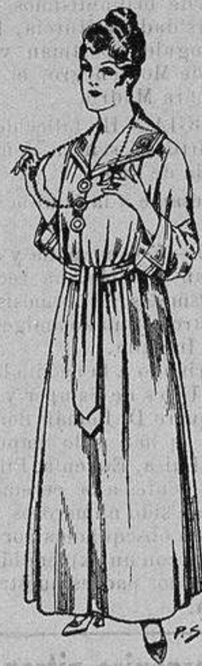
Batas de crespón, color cuello bordado De ptas. 10 a 15

Camisería, Géneros de Punto, Corbatería, Guantería, Sombrerería, Zapatería, Paraguas, Bastones y Artículos de Viaje.