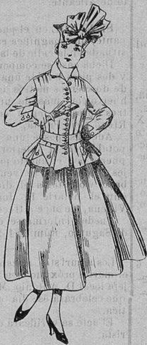
Trajes de lanilla, negra, azul y color. A ptas. 70