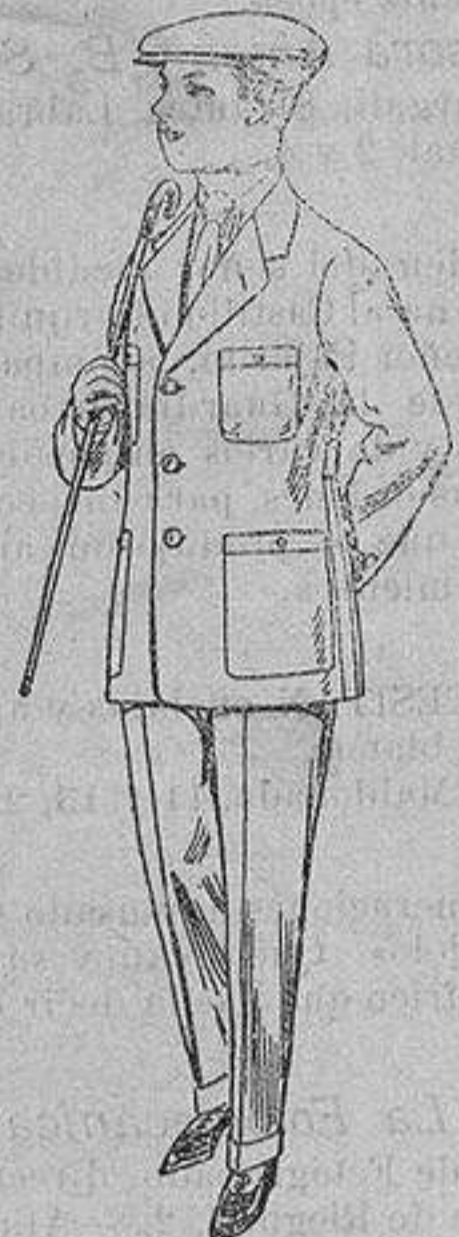
Trajes modelo sport, de dril listado, para jovencitos de 15 a 16 años. De ptas. 17 a 48.