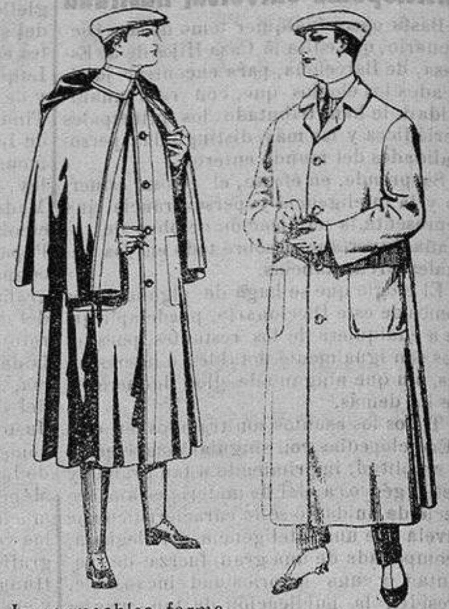
Impermeables forma mackferland, en negro y azul. De ptas. 55 a 100