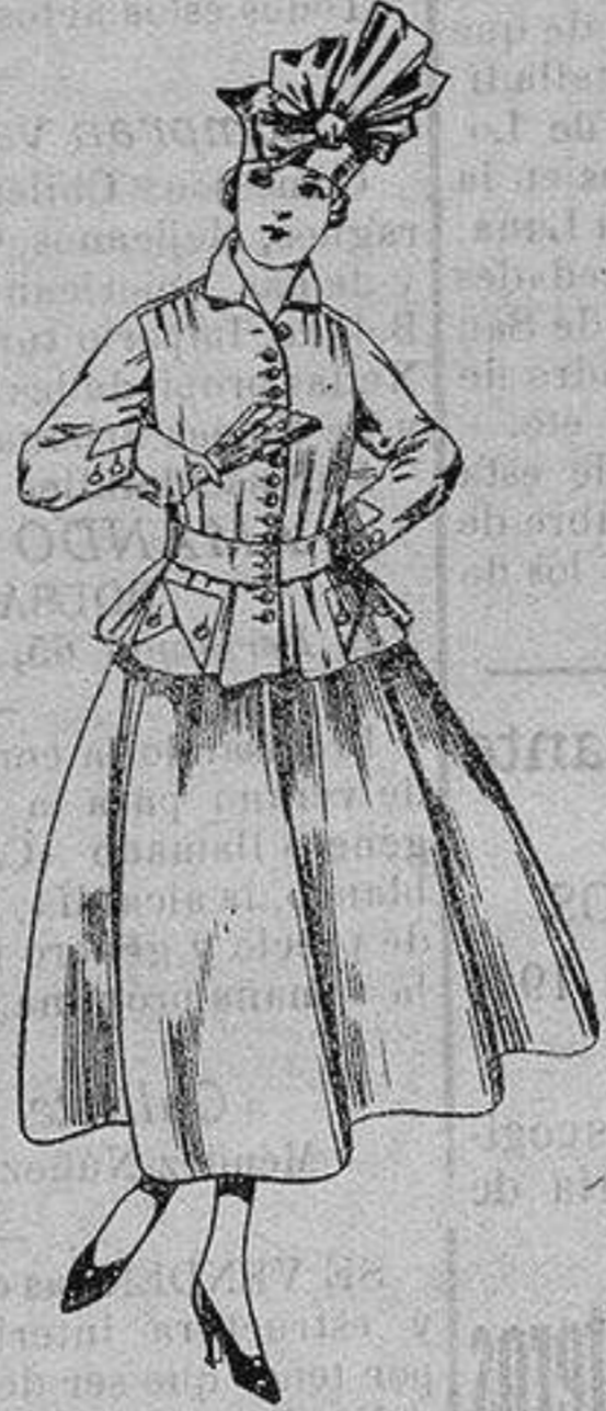
Trajes de lanilla, negra, azul y color. A ptas. 70

Rop s co r fccion ds para Caball ro, Señora, Niño y Niña