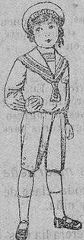
Trajes marinera de vicuña azul para niños de 4 a 9 años. De ptas. 6 a 20