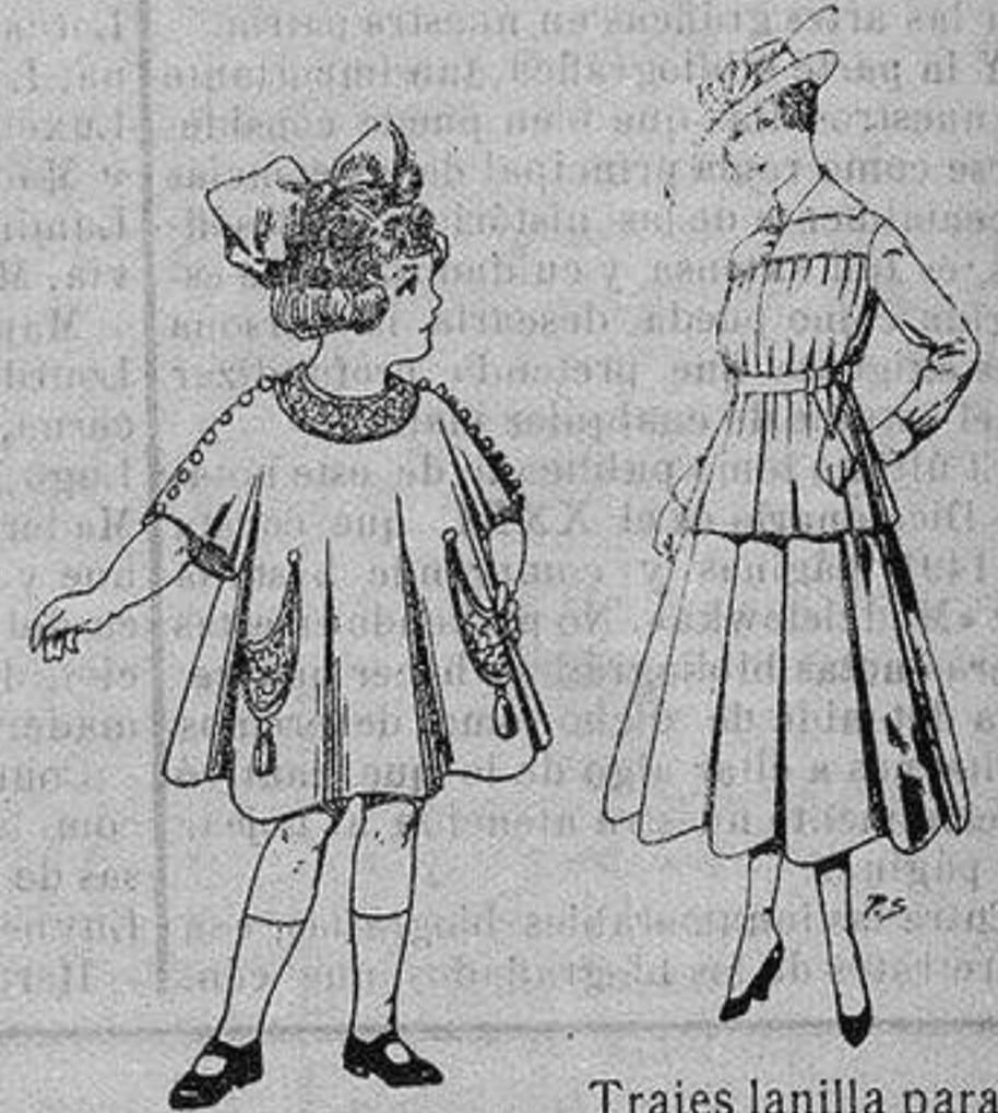
Vestidos de lanilla para niñas de 4 a 9 años De ptas. 30 a 38