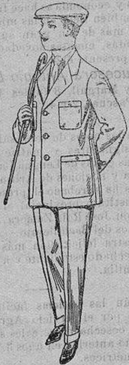
Trajes modelo sport, de dril listado, para jovencitos de 15 a 16 años. De ptas. 17 a 48.

Rop s co r fccion ds para Caball ro, Señora, Niño y Niña