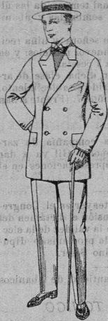
Trajes de vicuña o gerga, negros y azules. De ptas. 38 a 75