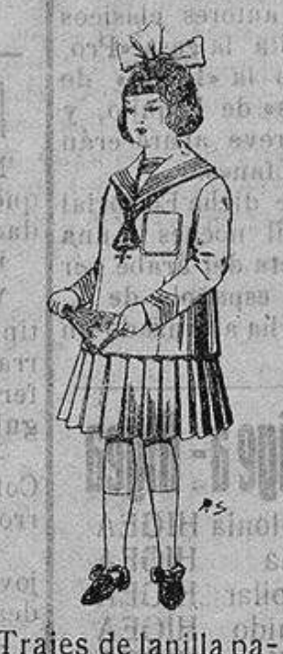
Trajes de lanilla para niñas de 4 a 12 años. De ptas 32 a 40

Camisería, Géneros de Punto, Corbatería, Guantería, Sombrerería, Zapatería, Paraguas, Bastones y Artículos de Viaje.