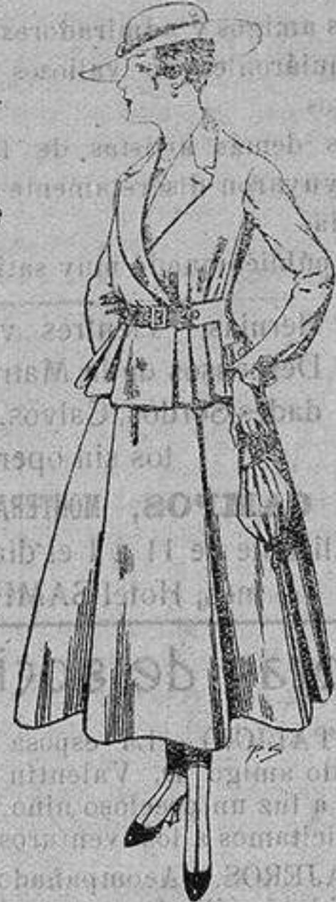
Trajes de lanilla para Señora. A ptas. 70