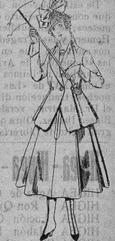
Trajes de lanilla para jovencitas, de 13 a 16 años. De ptas. 53 a 55