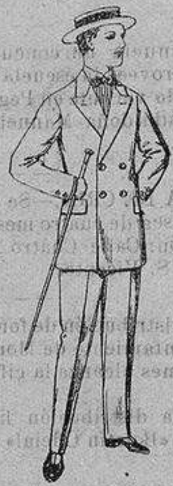
Trajes de lanilla, para jovencitos de 10 a 16 años. De ptas. 17 a 48