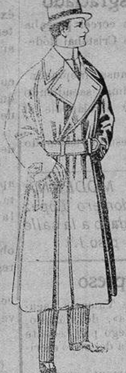
Gabanes impermeabilizados en color beige. De ptas. 65 a 110