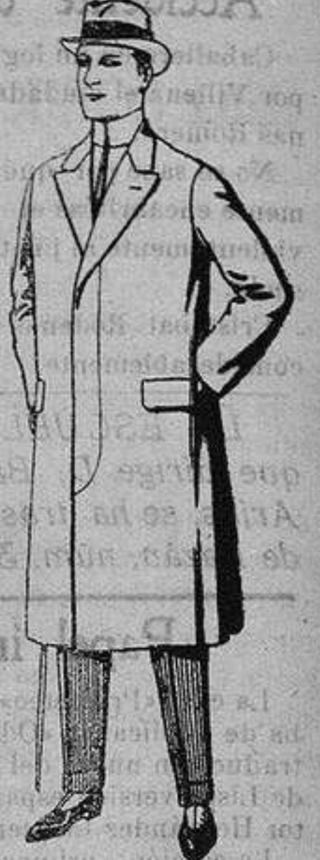
Pardesus de melton o vigonia. De ptas. 25 a 100