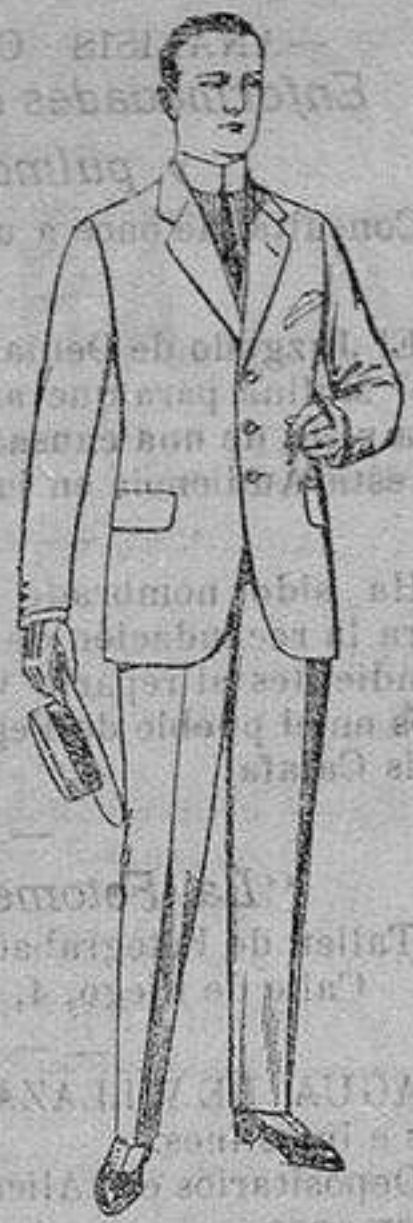
Trajes de lanilla, cheviot, etc. De ptas. 17'50 a 73

Madrid, Barcelona, Alicante, Almeria, Bilbao, Cádiz, Cartagena, Gijón, Granada Málaga, Palma de Mallorca, Santander, Sevilla, Valencia, Valladolid y Zaragoza.