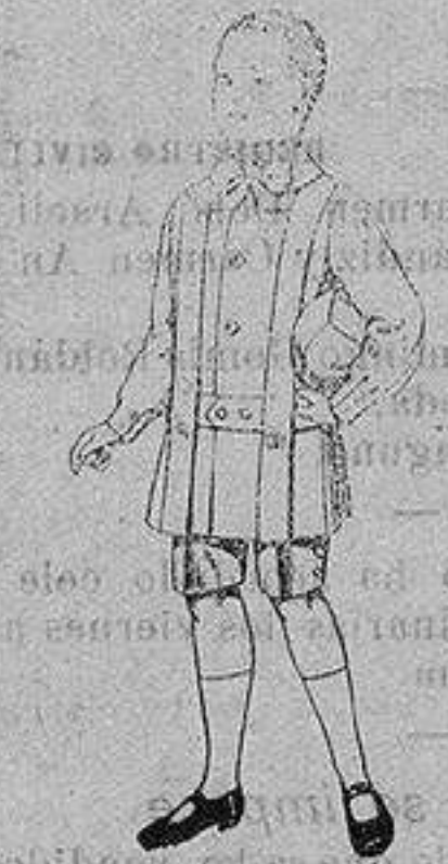
Trajes de lanilla para niños de 4 a 9 años. De ptas. 12 a 31