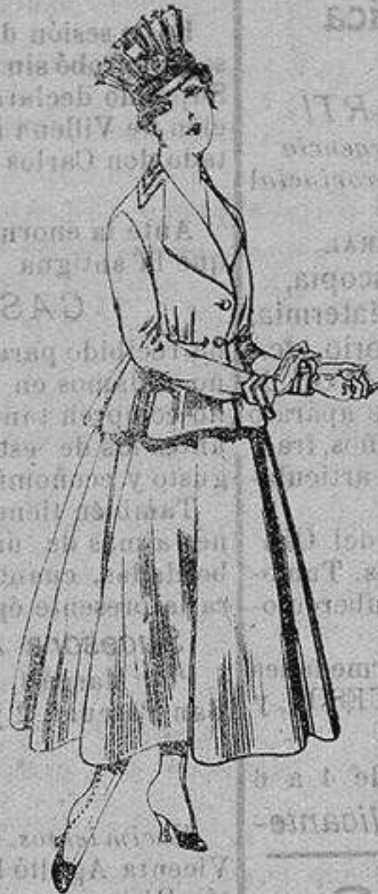
Trajes de lanilla para Señora. A ptas. 80