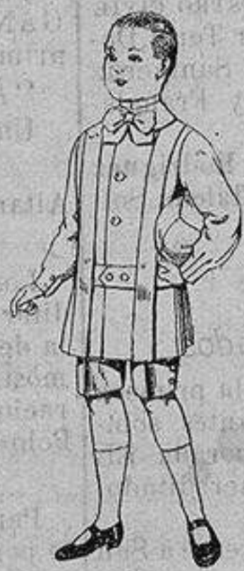
Trajes de lanilla para niños de 4 a 9 años De ptas. 12 a 31