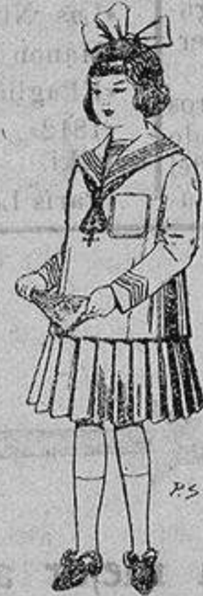
Trajes de lanilla para niñas de 4 a 12 años De ptas. 32 a 40