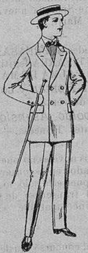
Trajes de lanilla, para jovencitos de 10 a 16 años. De ptas. 17 a 48