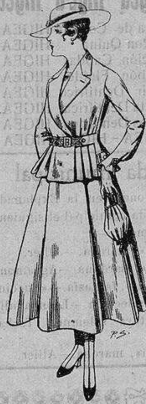
Trajes de lanilla para Señora A ptas. 70