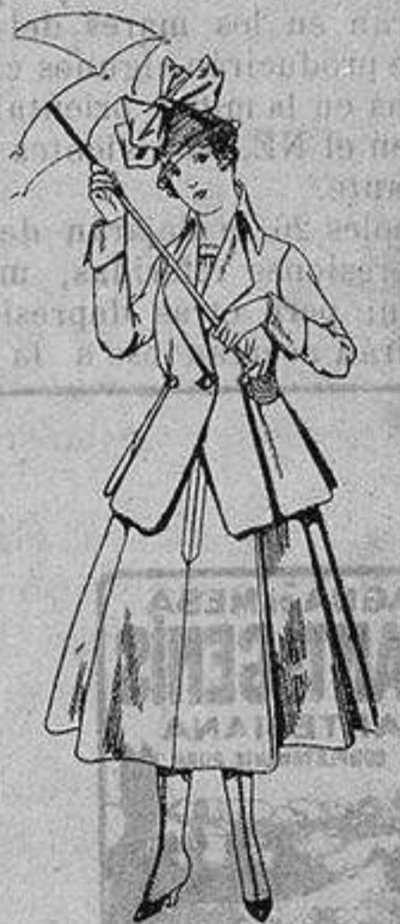
Trajes de lanilla para jovencitas de 13 a 16 años De ptas. 53 a 55