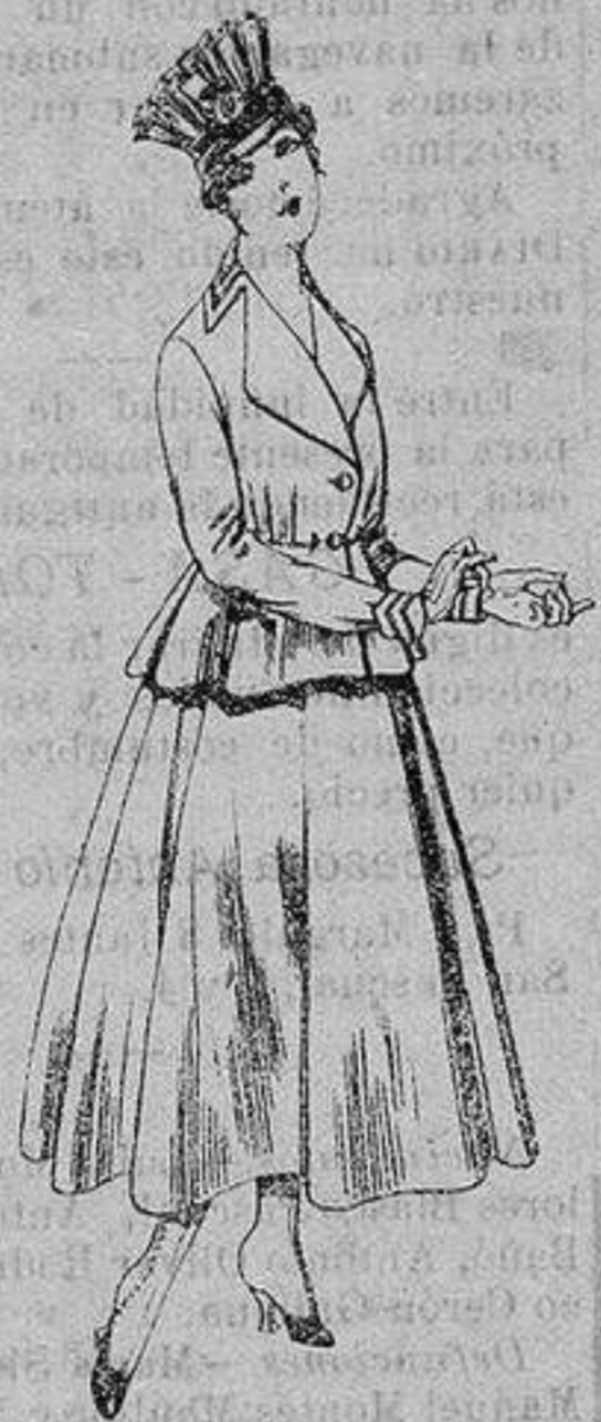
Trajes de lanilla para Señora A ptas. 80