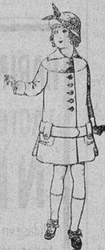
Abrigos de patén para niños de 4 a 12 años De ptas. 15 a 25