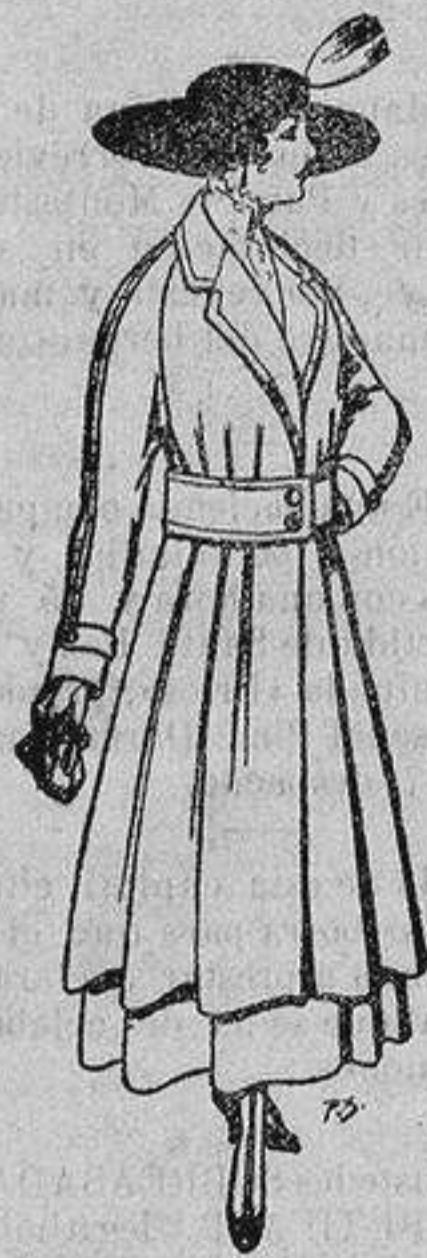
Abrigos de patén gran novedad para señora A ptas. 50