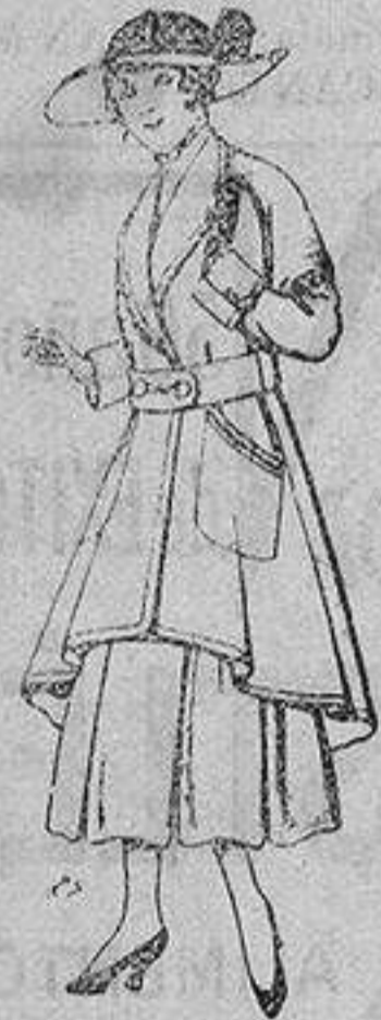
Abrigos de patén para jovencitas de 13 a 16 años De ptas. 25 a 35