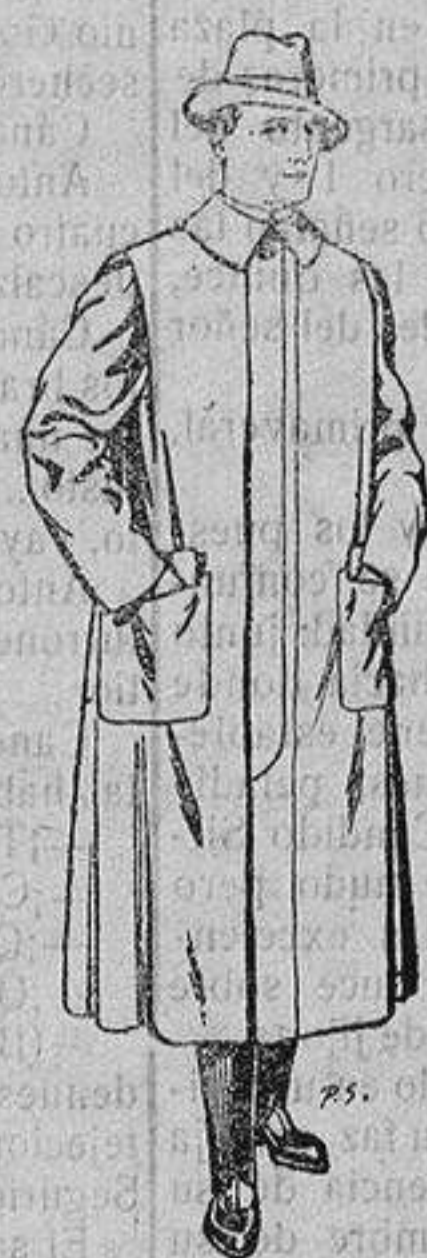
Impermeables forma gabán en color beige o gris De ptas. 35 a 100