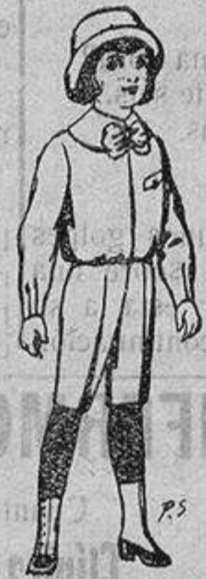
Trajes de patén para niños de 4 a 9 años De ptas. 5 a 7'50