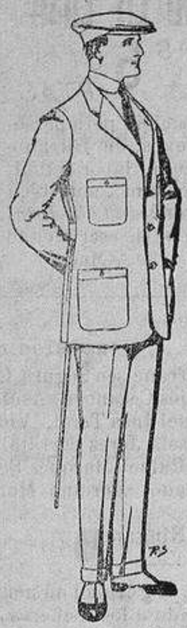
Trajes de cheviot corte elegante para «Sportman» De 35 a 50 ptas.

Peletería, Camisería, Generos de Punto, Corbatería, Guantería, Sombrerería, Zapatería, Paraguas, Bas- tones y Artículos de Viaje.