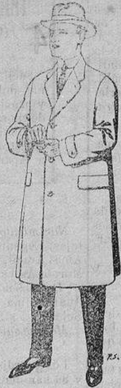
Gabanes de tejido pluma o satina De ptas. 30 a 100