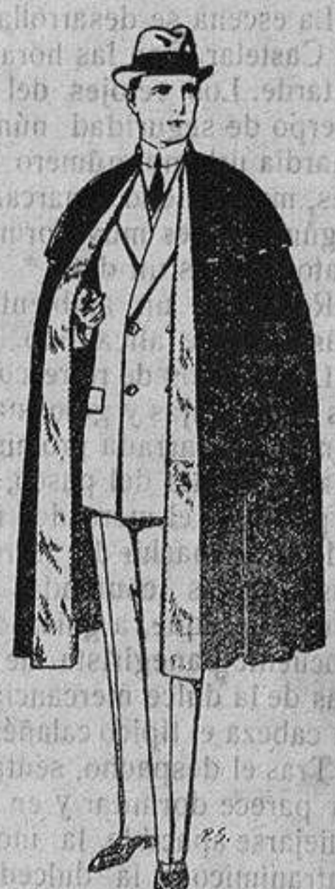
Capas (enteras) de paño De ptas. 25 a 100