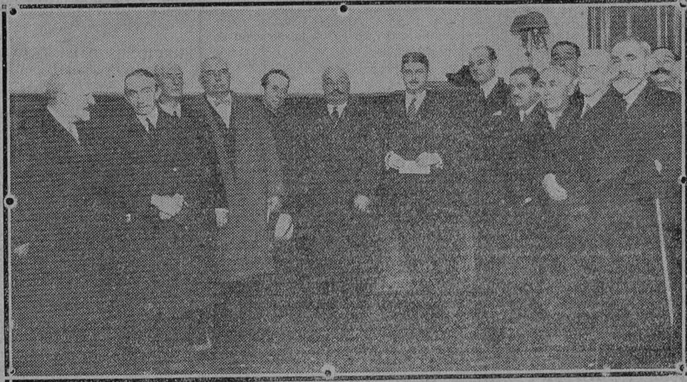
La Junta Nacional del Comercio Español en Ultramar durante la visita que hizo al ministro de Economía, señor de los Andes, después de la reunión celebrada ayer mañana.

Herres con rotativas Lules Delirrey, linotipias estereotipias y quizás hueco grabado... No les extraña porque la gente habla mucho y no tendría nada de particular que, poniéndonos a tono de los demás, echáramos la casa por la ventana. Como en todo lo anterior la fantasía de los comentaristas puede ir más allá de la jactancia de los proyectistas... esperemos unos días o unos meses a ver en que quedan todos esos anuncios... que parecen sueños de día de Inocentes.