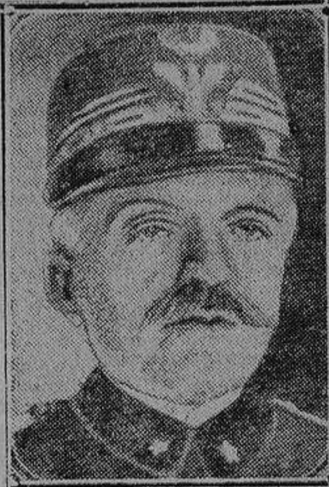
EL GENERAL CADORNA ilustre militar italiano que tanta responsabilidad tuvo en la dirección de la Gran Guerra