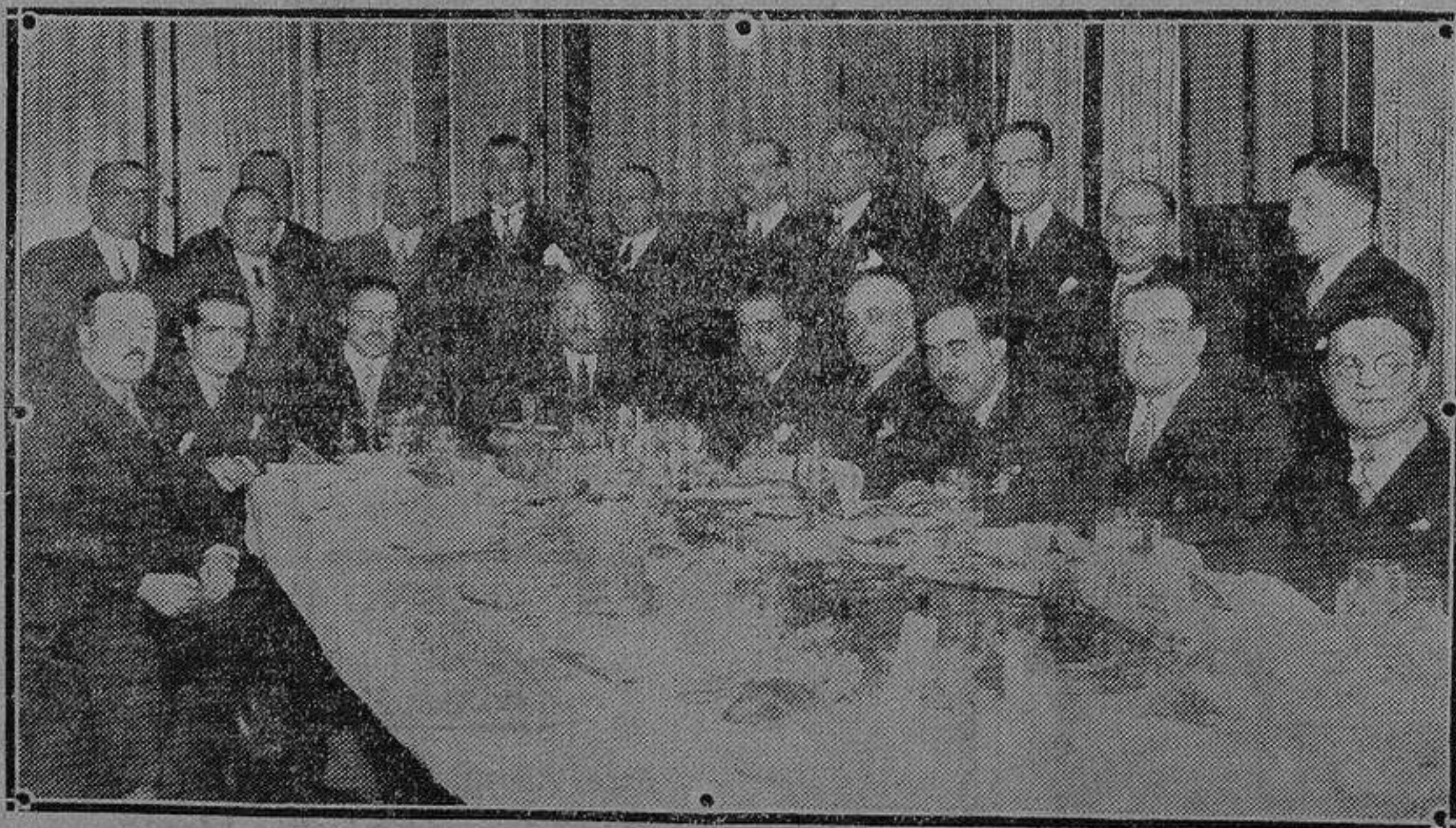
Concurrentes al banquete con que anualmente renuevan los votos por el mantenimiento de los viejos vínculos de una perdurable amistad, nacida en los claustros de la Universidad de Madrid, los abogados que terminaron sus estudios el año 1906. La simpática fiesta se celebró el sábado último en Tournié

desentonar lo más mínimo, y la puesta en escena irreprochable.