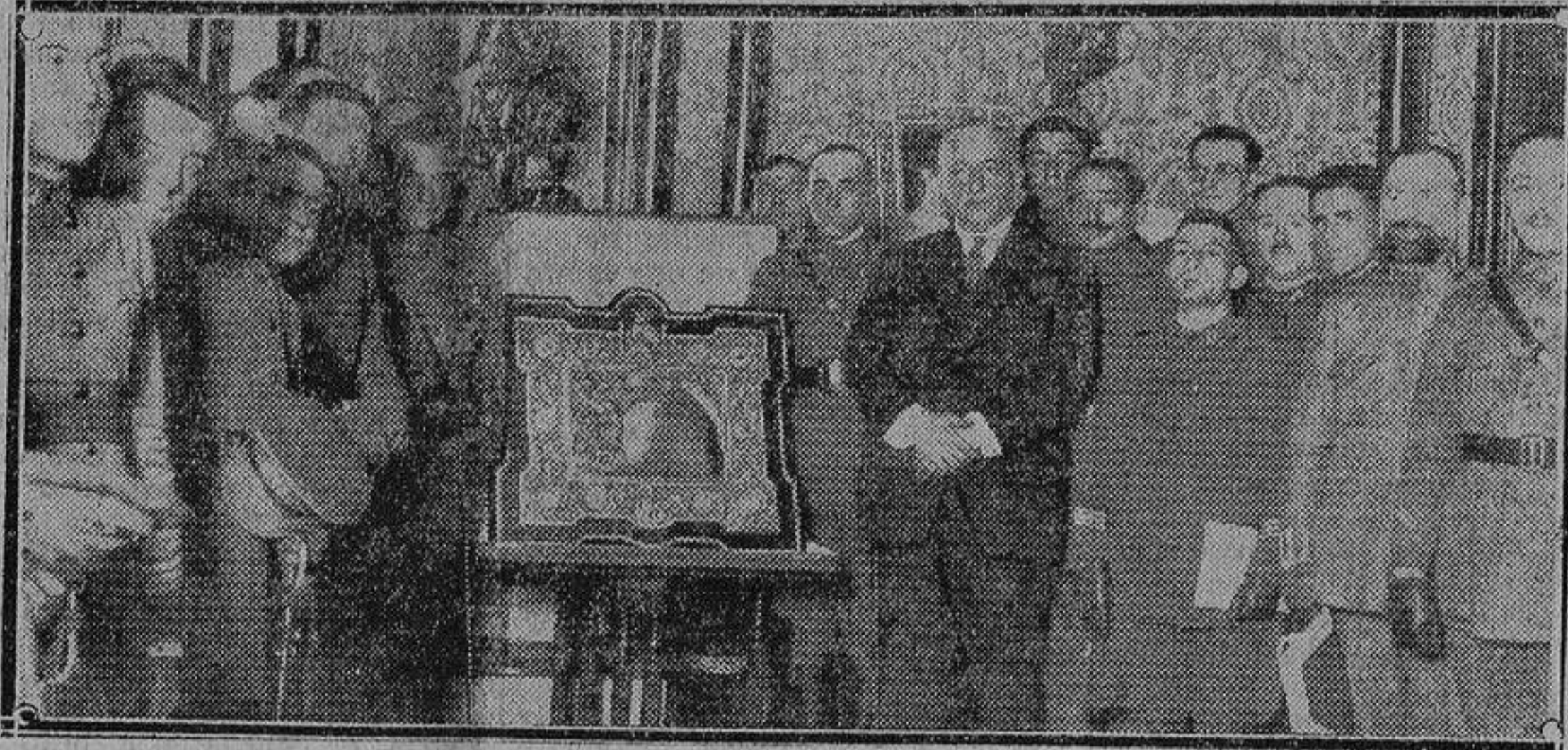
Las clases de segunda categoría entregando al jefe del Gobierno una artística placa de plata repujada como homenaje de gratitud