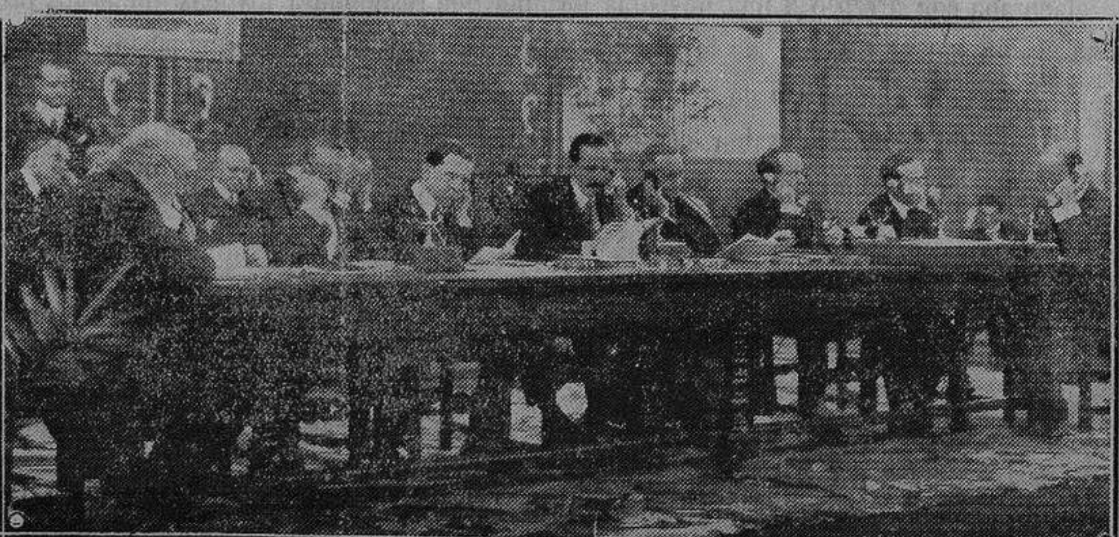
Inauguración del teléfono de España a Cuba bajo la presidencia del Rey