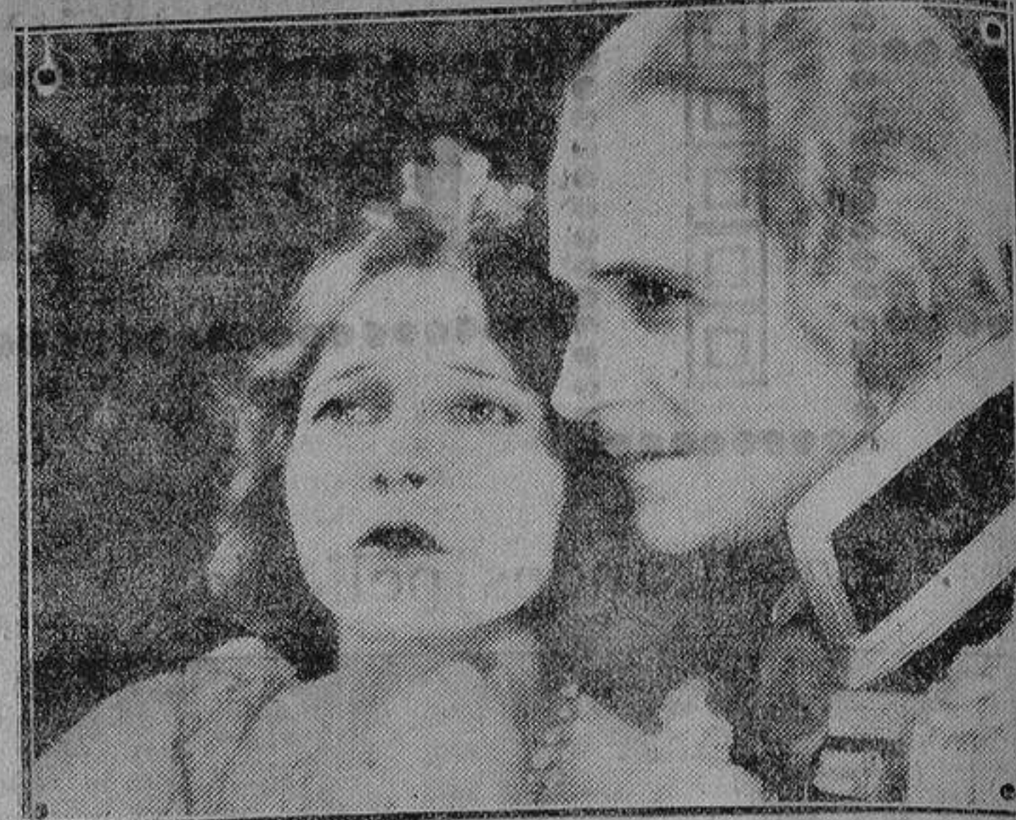
He aquí una muestra elocuente del valor del gesto en la cinematografía, tomada de una película conocida en la que intervienen artistas amantes