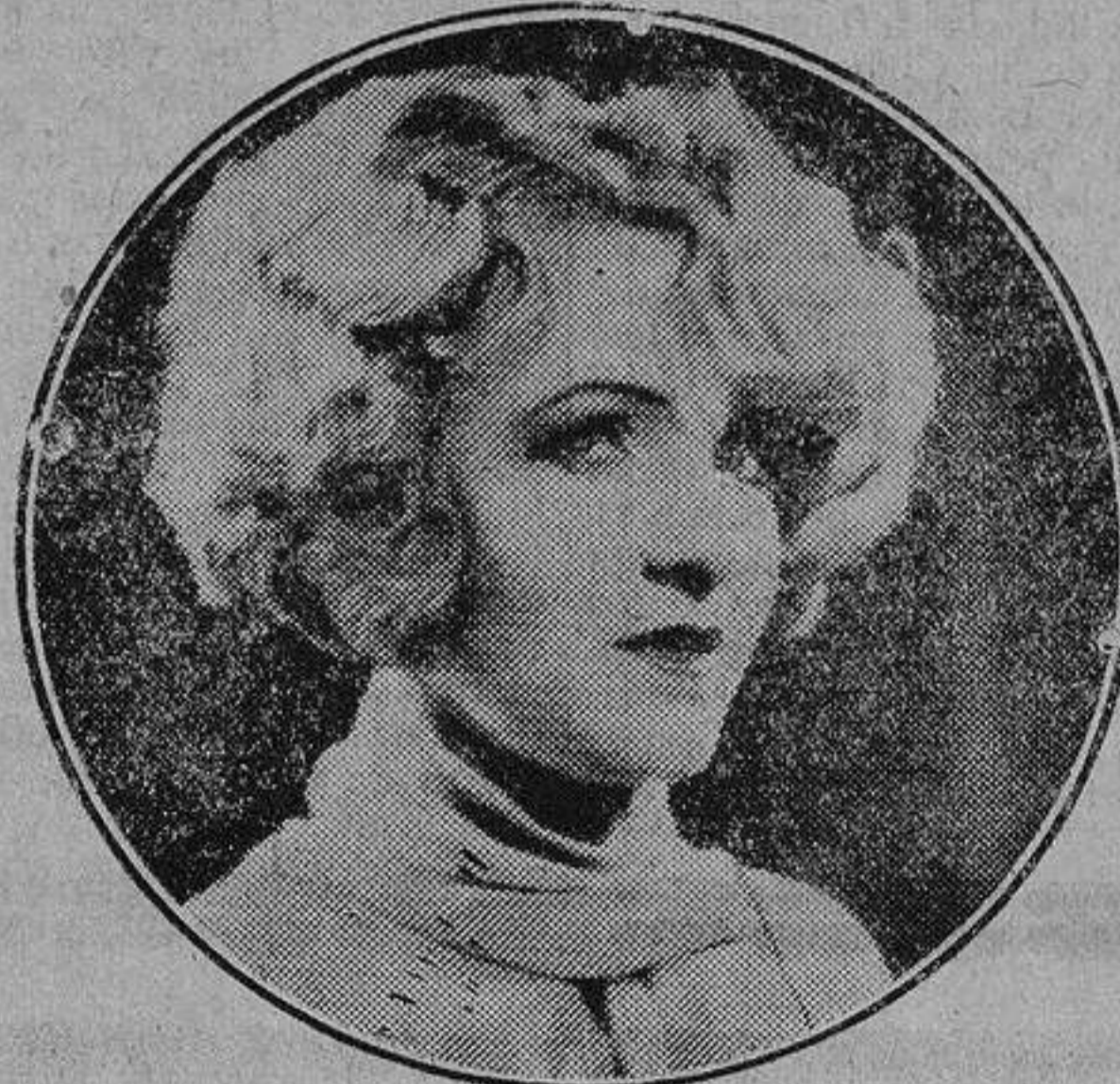
CLAIRE WINDSOR.—Una de las más bellas «estrellas» del séptimo arte