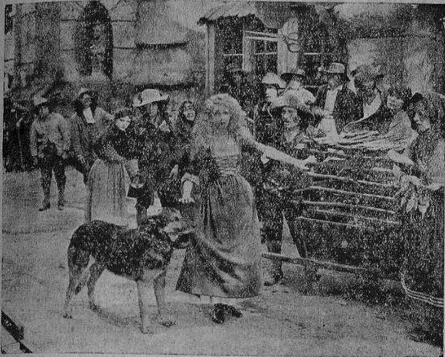
Una de las más bellas escenas de la asensacional película «El hombre que ríe» próxima a estrenarse en el Ideal