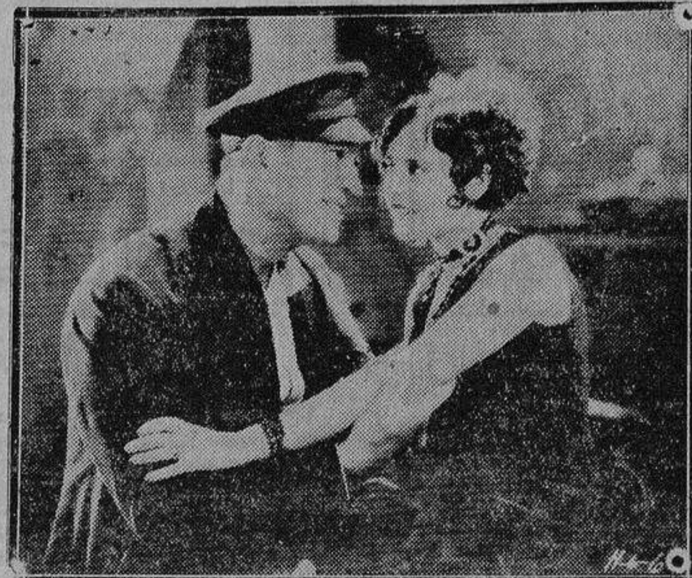
Dos de los más populares artistas cinematográficos en una escena de una de las películas últimas de mayor éxito.