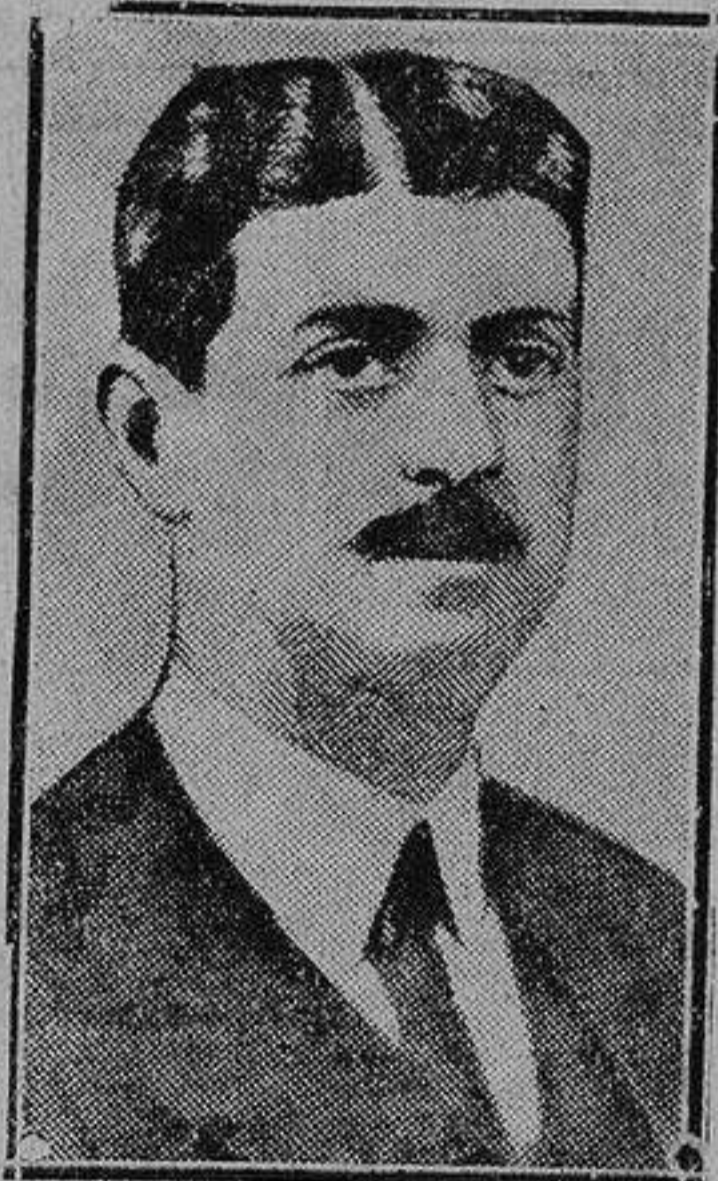
El Conde de los Andes primer ministro de Economía Nacional