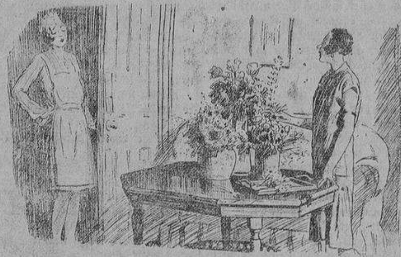
La señora.—Llaman al teléfono; vea quien es. La doncella.—Alguna amiga suya; las mías no llaman hasta la tarde.