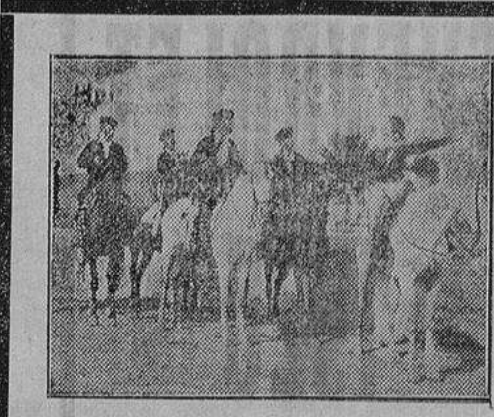
Evocación lujosa y real de los tiempos de la Corte de Carlos III y Carlos IV. Luchas heroicas y valientes en los montes de SIERRA MORENA entre bandoleros y justicias.

Madrid (Teléfono).—Por orden del gobernador han sido puestos en libertad los seis obreros panaderos que sufrían detención gubernativa desde hacía varios días como consecuencia de los pasados sucesos.