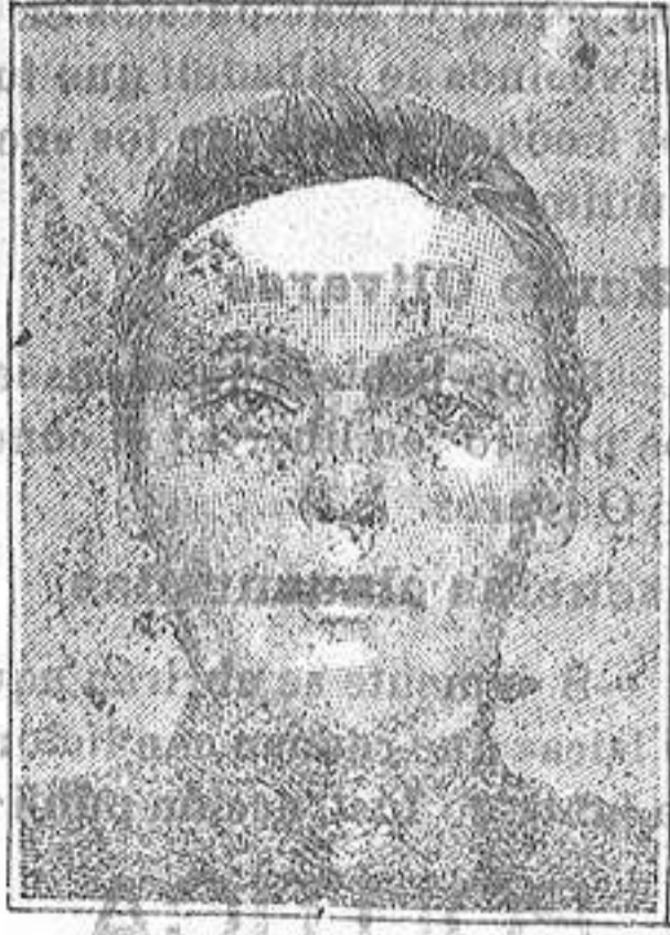
Después de la curación