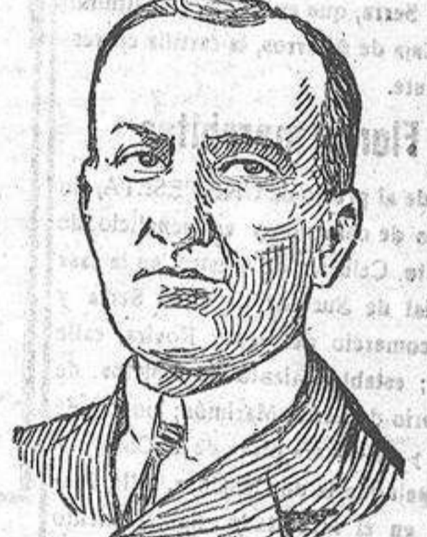
El ministro de Marina don Mateo García de los Reyes, que dirige las maniobras navales en Santa Pola y Cartagena.