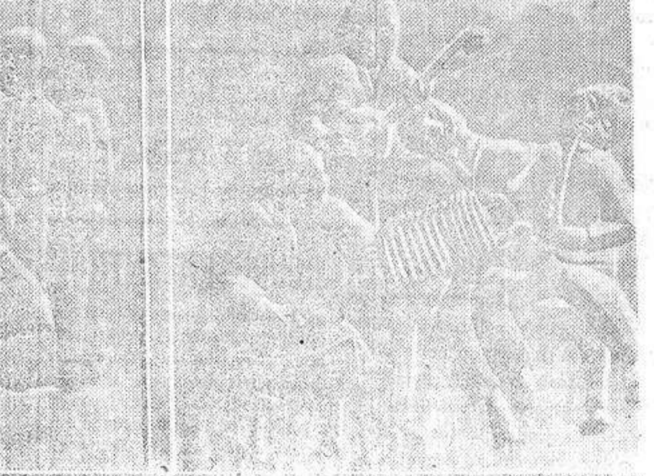
Tableros de las puertas del convento de la Merced, de Méjico, donde está instalada la Escuela de Escultura.

Porque el instinto certero de la infancia, amorosamente dirigido no se detiene en la periferia. Ya se sabe que el niño, como los artistas de la primera edad del mundo, para la representación de los