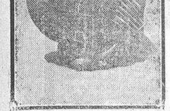
Talla directa en piedra.

del verano ha restado el concurso del público habitual, ya ausente de Madrid o abito del farrago de Exposiciones invernales—la Universidad Nacional mejicana ha realizado los trabajos de sus Escuelas de Escultura y Pintura en una síntesis hermosa de esfuerzos y alientos juveniles. Aparte otra suerte de consideraciones críticas, que no serian oportunas, el ejemplo de Méjico de muestra cómo un pueblo celoso de su prestigio cultural puede elevarse con sólo el estímulo inteligente de los instintos populares,