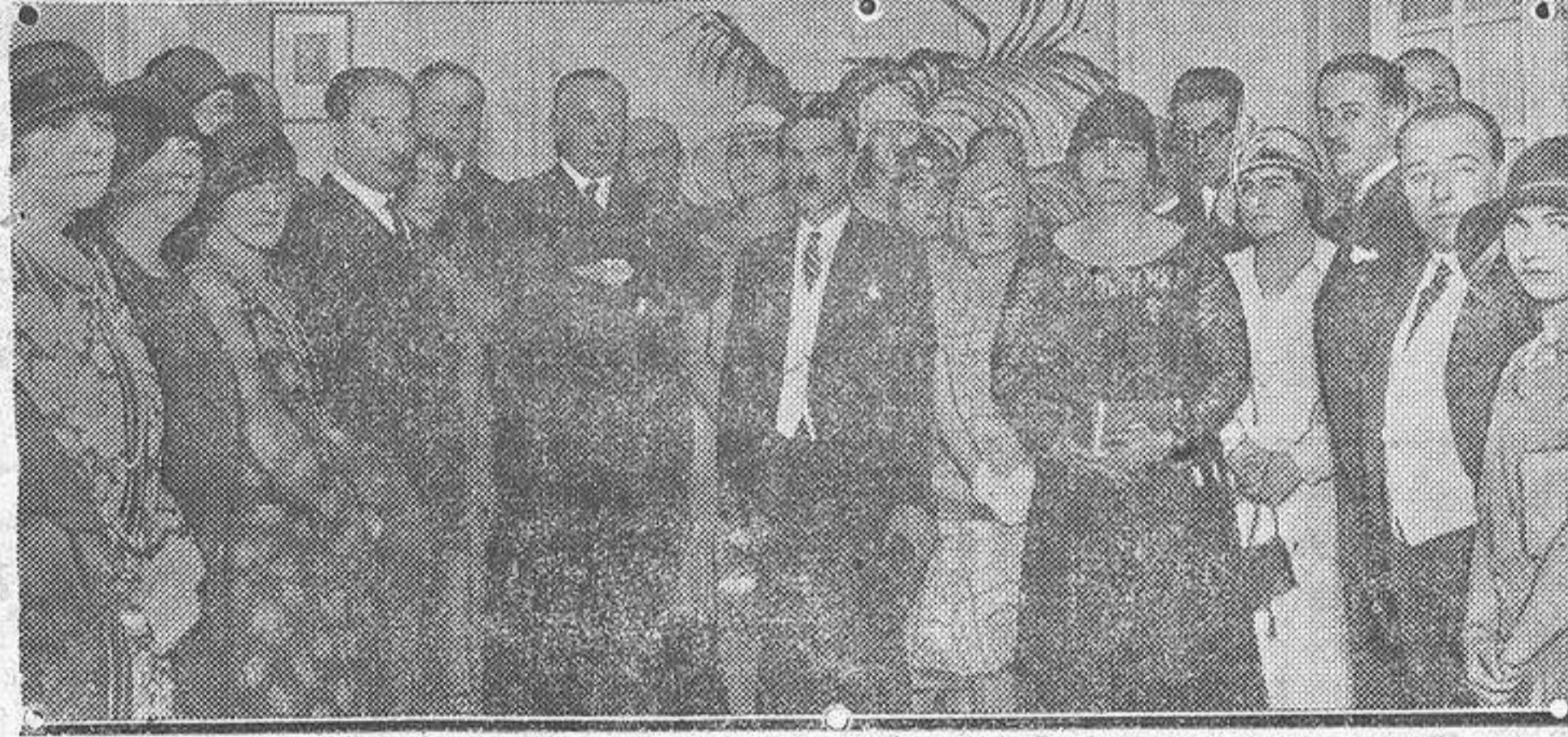
El presidente del Consejo, marqués de Estella, y el de la Asamblea, señor Yanguas, rodeados de los concurrentes a la fiesta celebrada en su honor en la Legación de Venezuela.