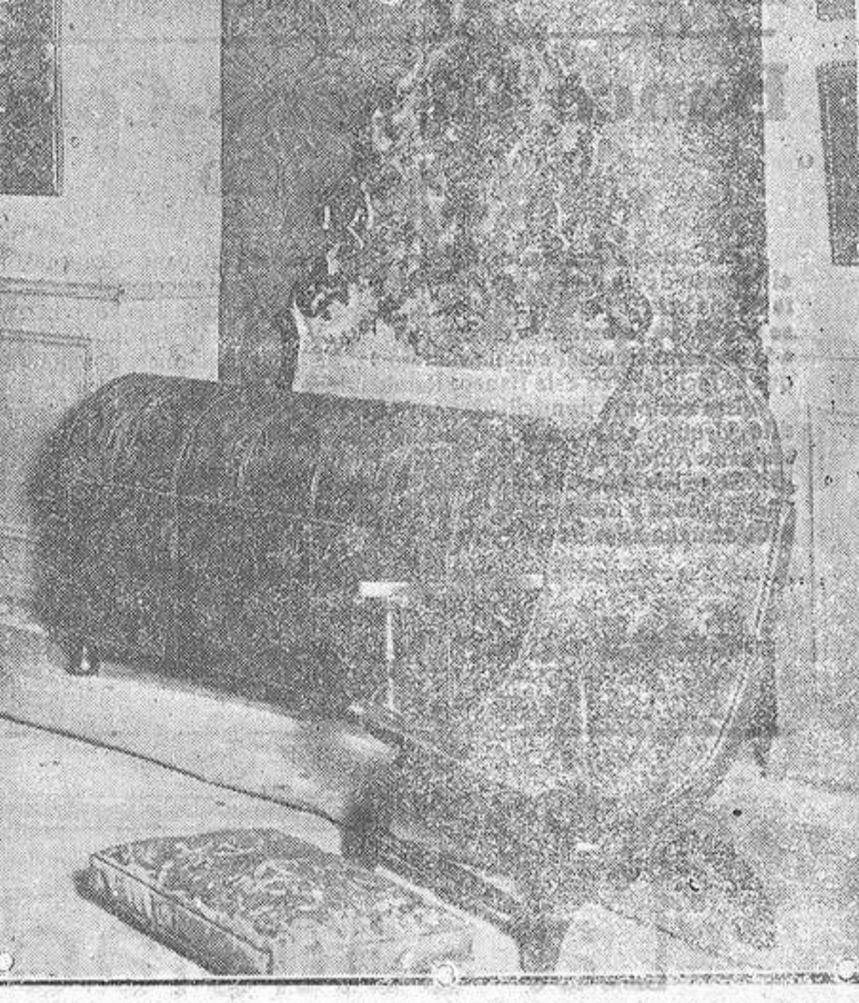
Arca, sillón y cabecera de cama, en cuero repujado y policromado, que figuran en la Exposición de José Lapyayese

Hace tiempo venimos observando el fenómeno. Tal vez como síntoma del materialismo actual, las bellas artes van perdiendo sus más puros valores espirituales para convertirse en artes utilitarias. Quizá obedezca a una de las muchas reacciones históricas a que nos tiene habilitados el progreso de la Humanidad. Es como si volviéramos a los genes del arte, al concepto primitivo del arte, que respondía a las exigencias inmediatas de la vida. Las primeras industrias del hombre—los dólmenes, las herramientas, las armas de caza, los vestidos ru-