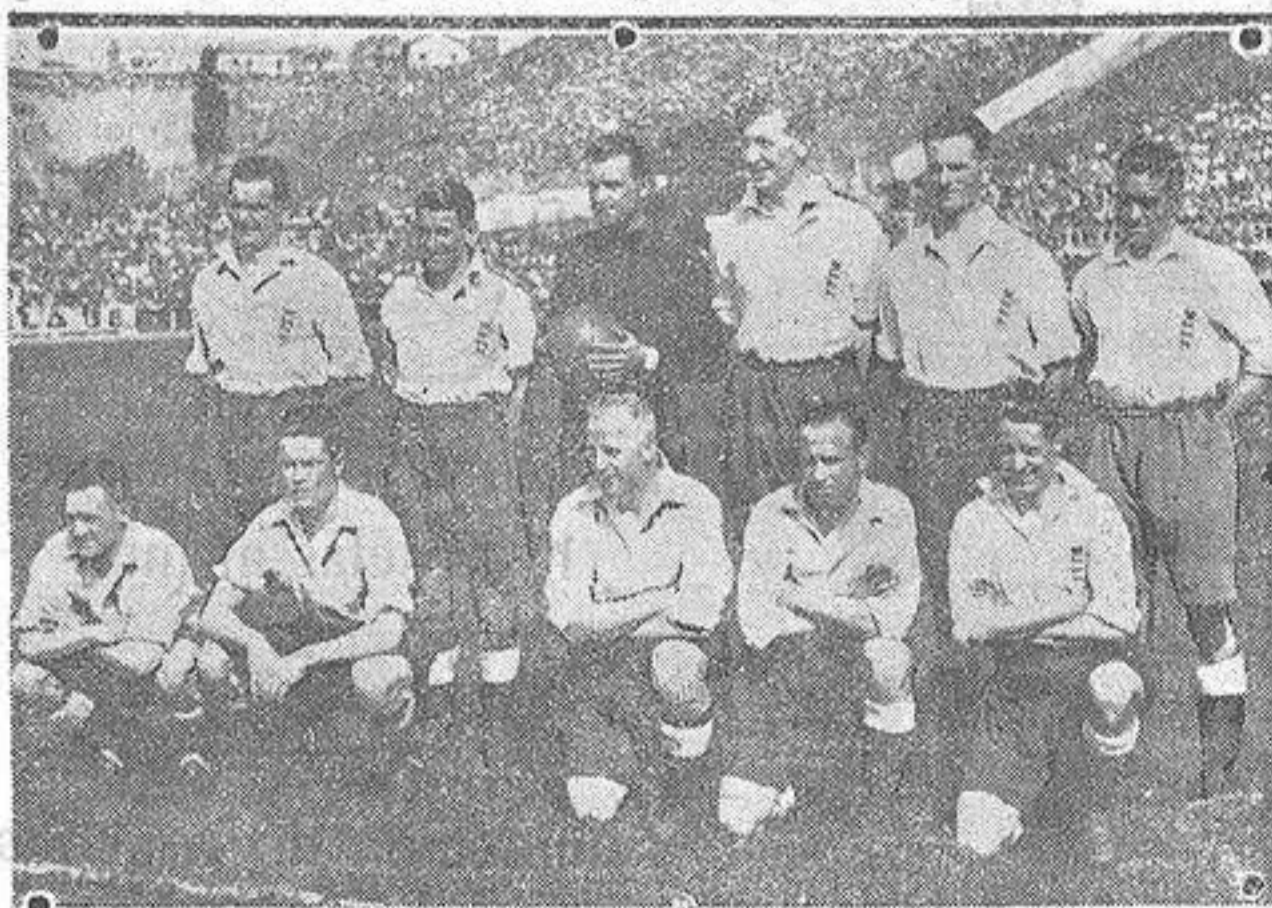
Los profesionales británicos, que realizaron una notable exhibición en Madrid sucumbiendo ante el equipo español