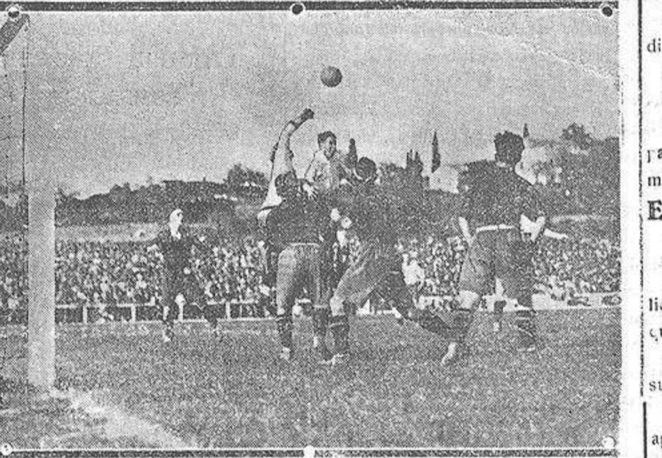
Una salida de Zamora en un «corner» durante el segundo tiempo del gran match de fútbol España-Inglaterra