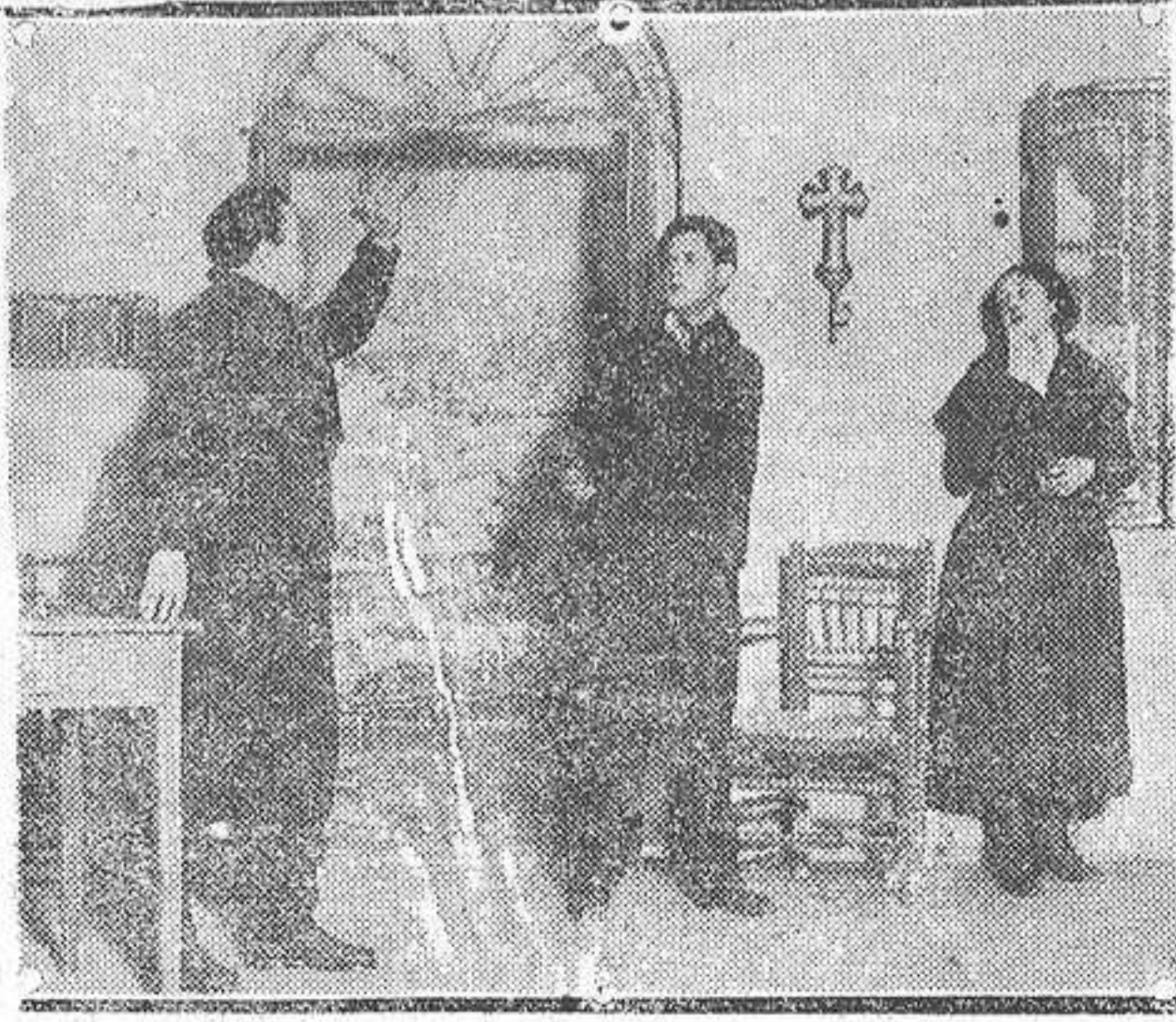
Escena de "La Santa", comedia dramática estrenada en el Teatro Cómico, de Madrid.