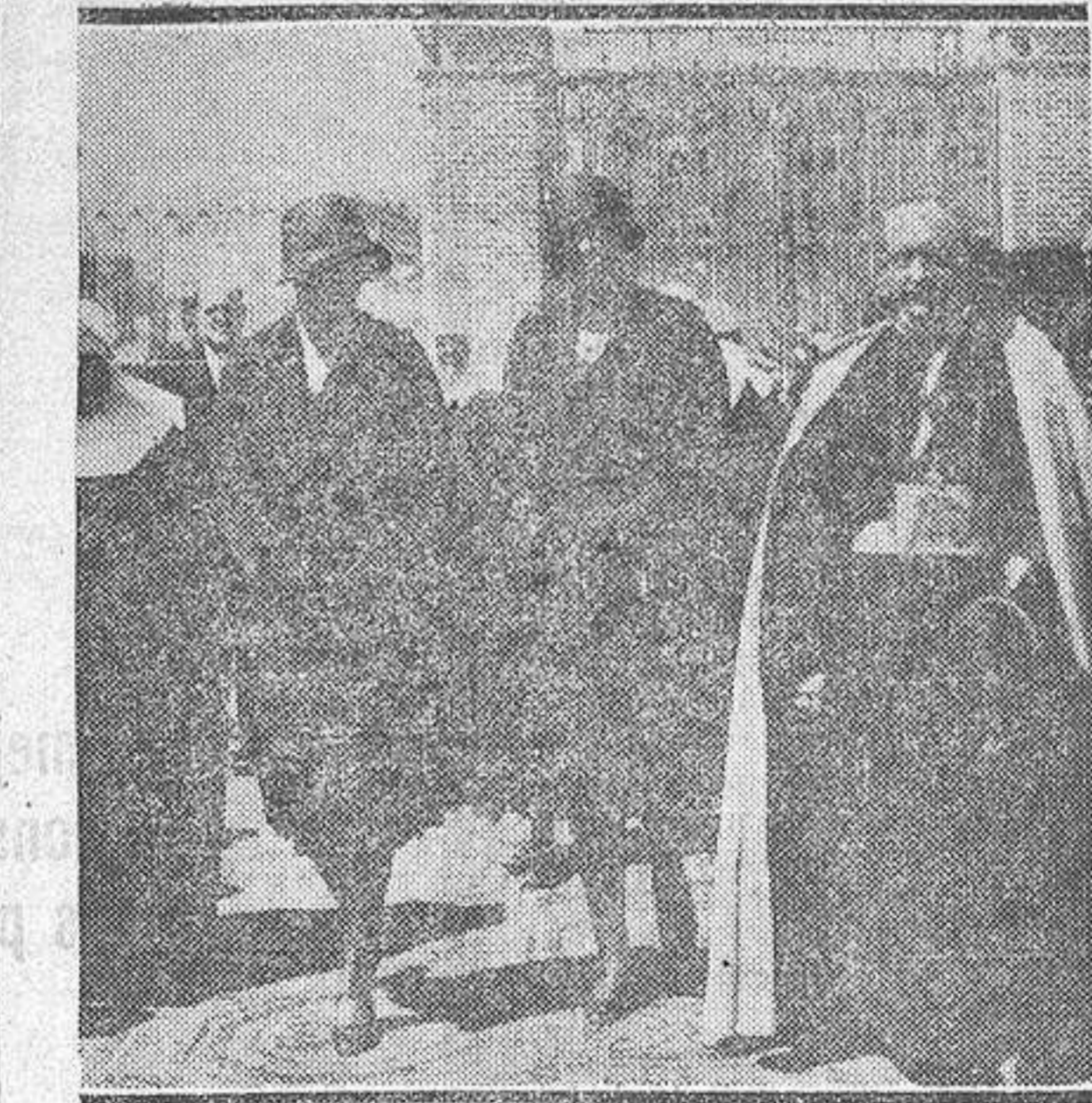
Sus Altezas las Infantas doña Cristina y doña Beatriz, con el obispo de Madrid-Alcalá, saliendo de inaugurar el Asilo de la Beata María Anan de Jesús, para niñas escrofulosas, raquíticas y lisadas, pobres,