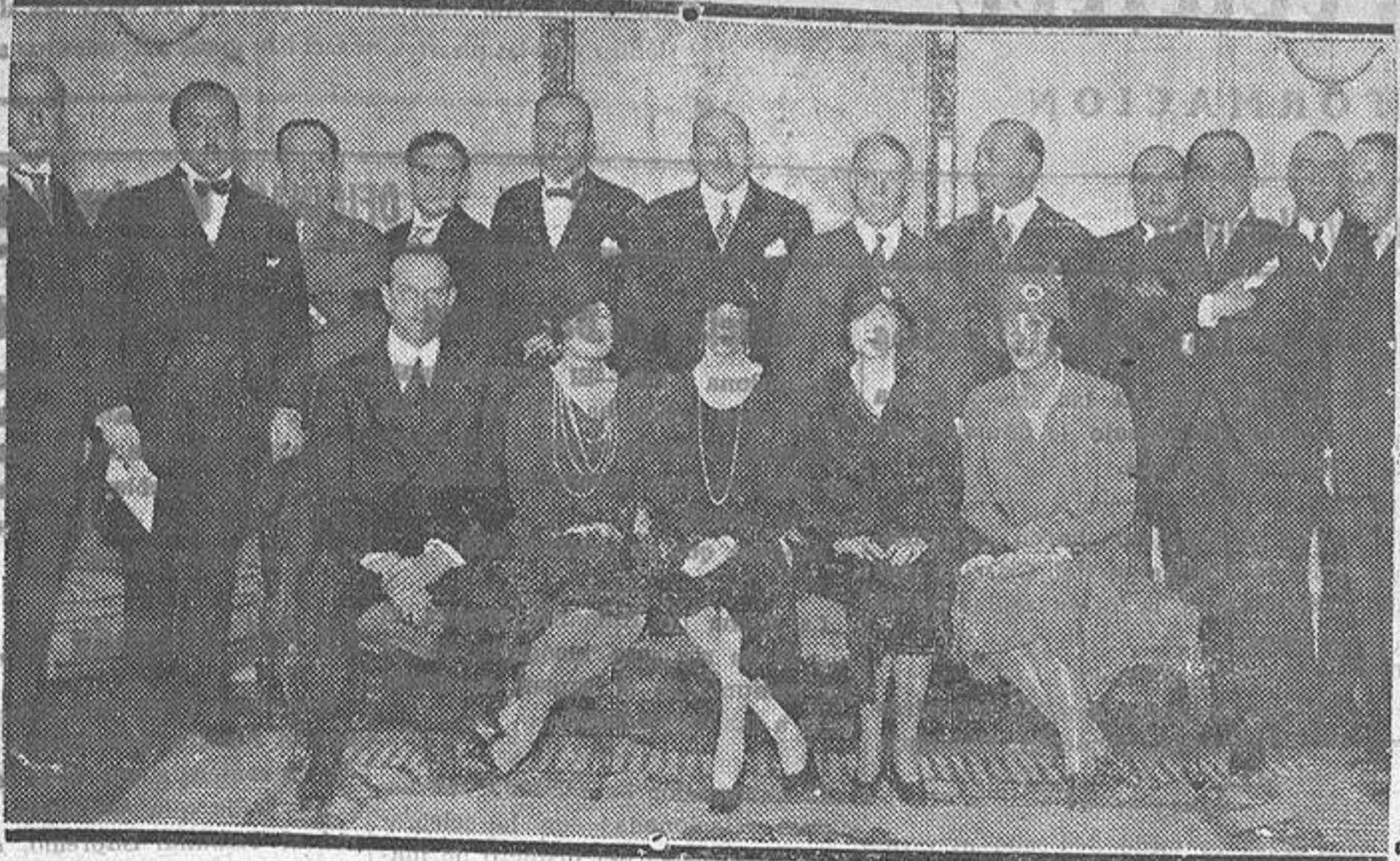
Algunos de los concurrentes al té ofrecido en la Embajada de los Estados Unidos con motivo de la presentación de la ilustradora norteamericana Mrs. Harry Payne Whitney, autora del monumento a Colón erigido en Huelva.