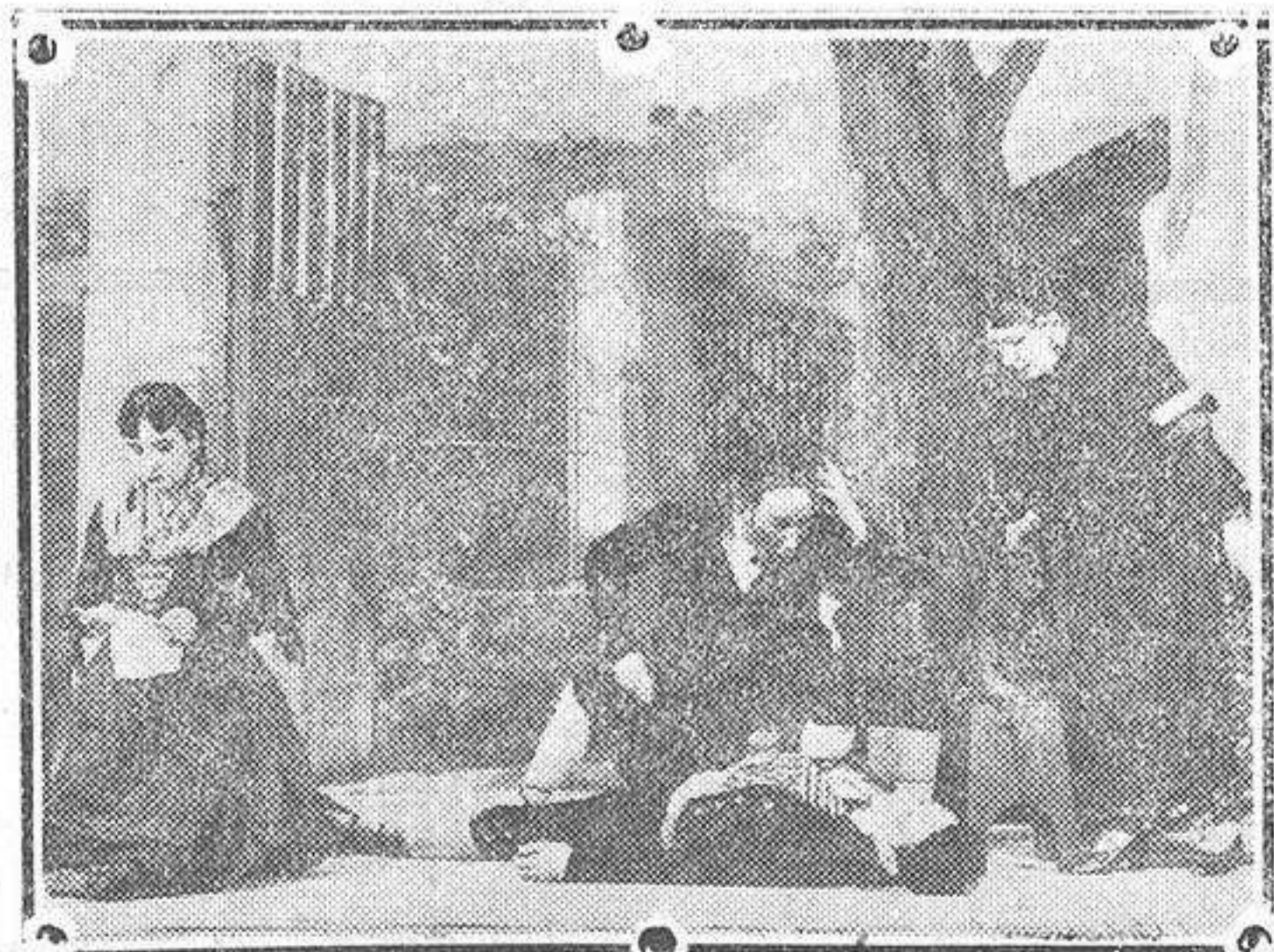
Una escena de «Coplas de Ronda», estrenada con gran éxito en el Teatro de la Zarzuela, de Madrid.