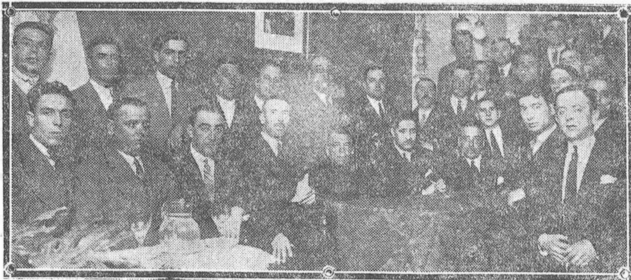
Concurrentes al importante acto celebrado en la Corte para inaugurar el Centro cultural «Unión y Progreso» instalado en la calle del General Ricardos.