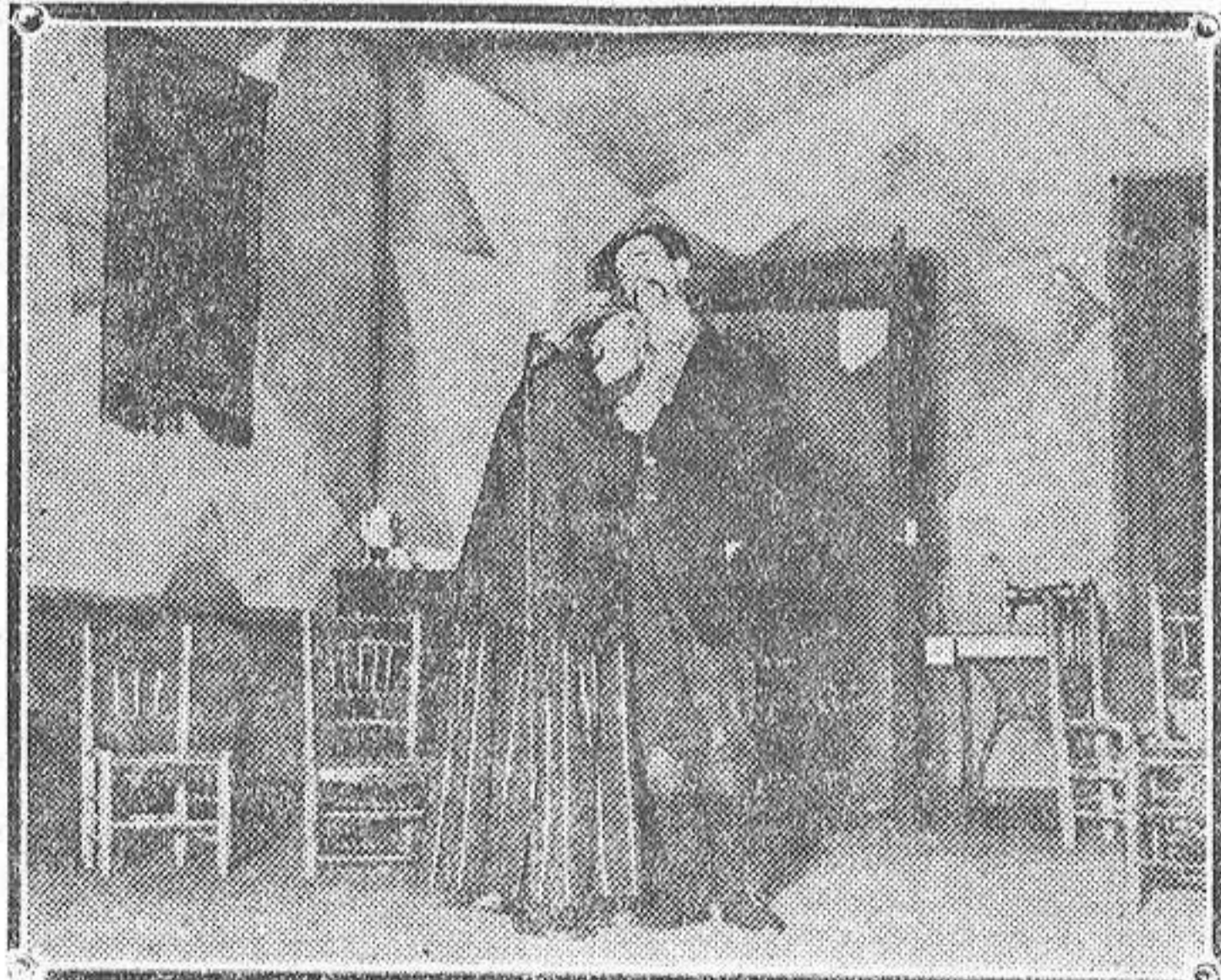
Una de las más interesantes escenas de «Mustafá», sainete estrenado con gran éxito en el teatro Esclava de Madrid