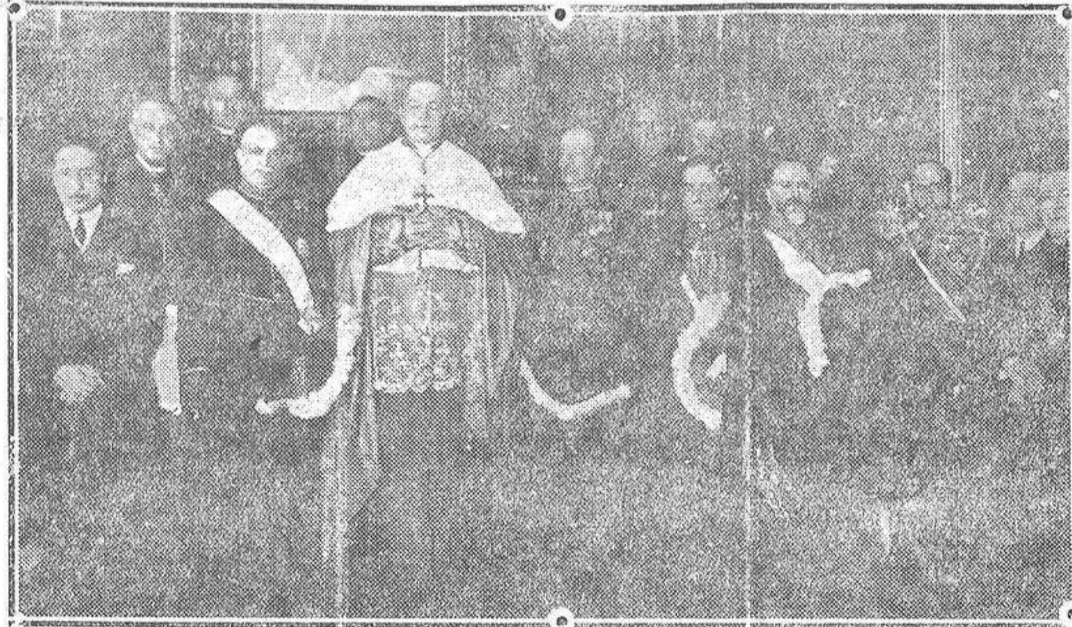
Concurrentes a la recepción celebrada en la Nunciatura para celebrar la firma del Tratado con el gobierno de Italia y el aniversario de la coronación de S. S. Pío XI