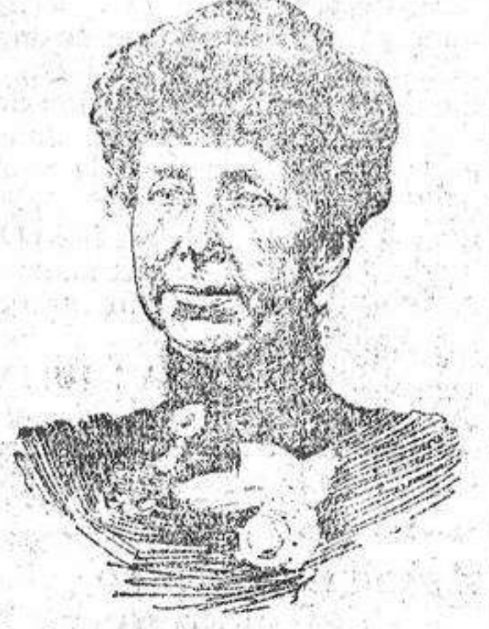
S. M. la Reina Madre doña María Cristina de Habsburgo, que ha fallecido casi repentinamente a los setenta y un años de edad.

consagrado al Redentor del linaje humano. Carlos V, el más esclarecido de los Césares, deseó este lugar para su reposo postrero. Felipe II, el más prudente de los reyes, lo diseñó. Felipe II, el más piadoso, lo comenzó. Felipe IV, grande por su clemencia y religiosidad, lo ensanchó, hermoseó y terminó en 1654.»