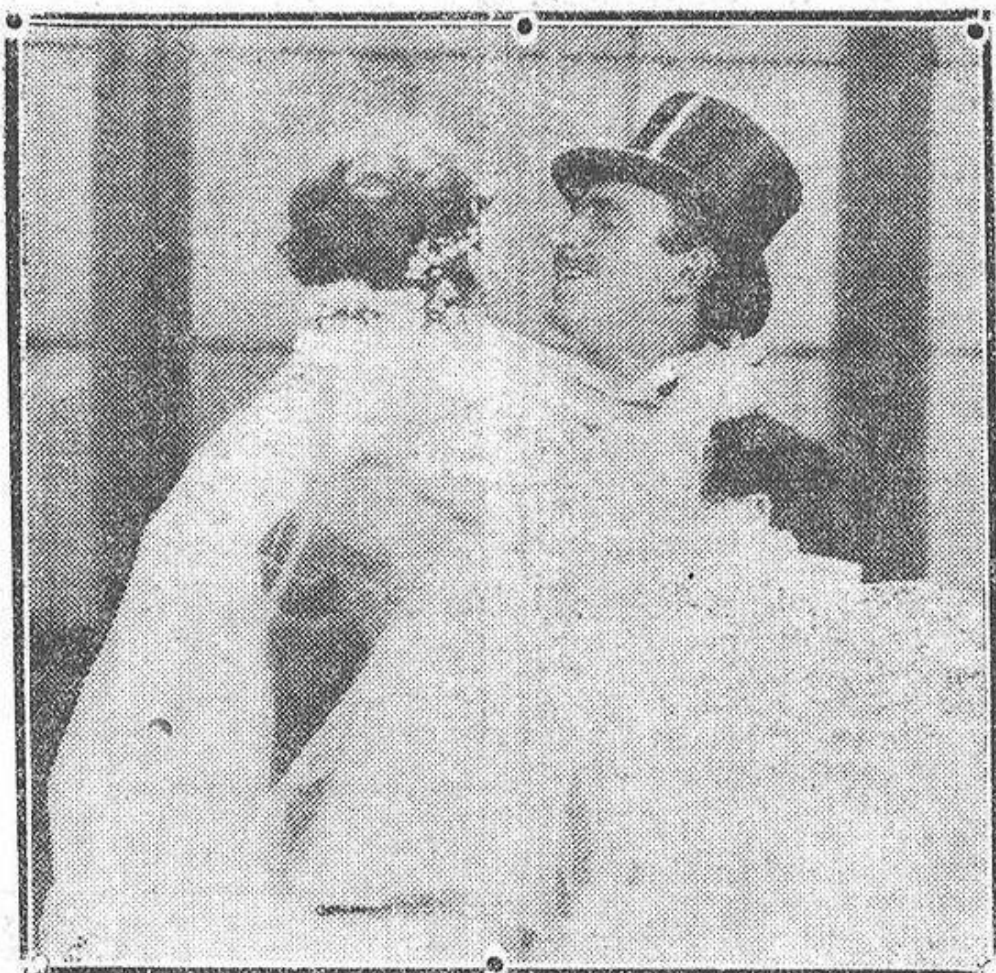
Raimond Griffith, el «señor de la chistera», en una escena delicosa de «¡Te qui ero, me quieres!...»