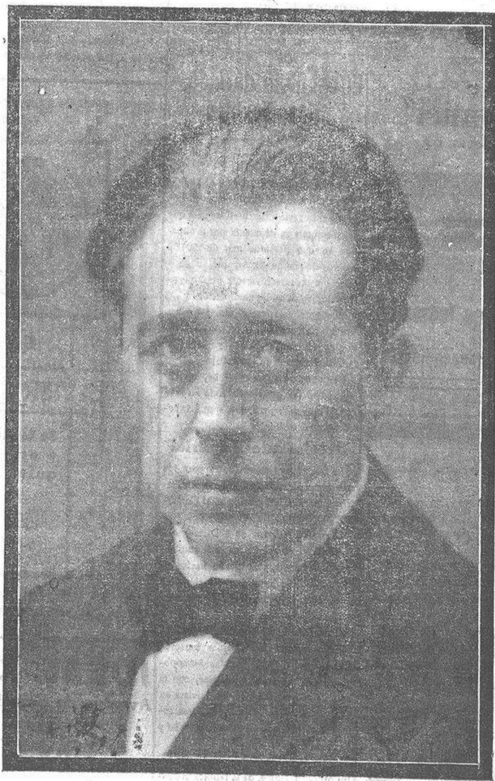
Gabriel Miró el glorioso escritor alicantino, fallecido ayer en Madrid

Sus últimas producciones: «El ángel, el molino y el caracol del ferrocarril», «Nuestro padre San Daniel», «El humo dormido», «El obispo leproso», «Añes y leguas», etc., con las «Figuras de la Pasión», y «Juntos su no abre icelazo hasta las cumbres más altas y puras del Arte». Gabriel Miró deja en la literatura española una huella indelebe.