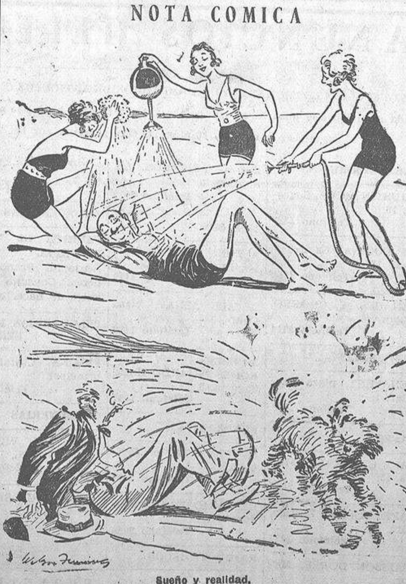
Sueño y realidad.

LAXANTE SALUD contra la bilis y el estreñimiento. Pídesse en farmacias.