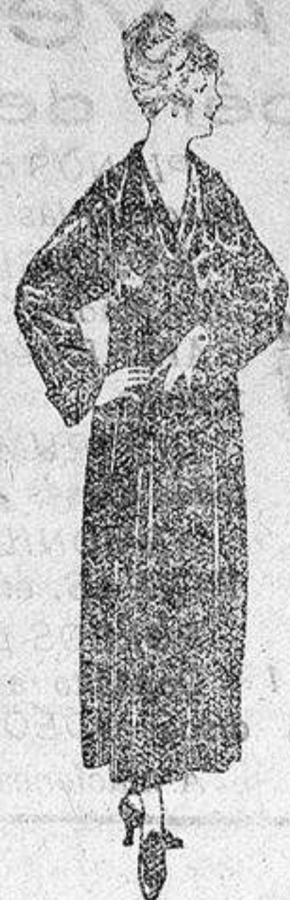
Batas de crespón, esterilla, etc., de ptas 32 a 46.