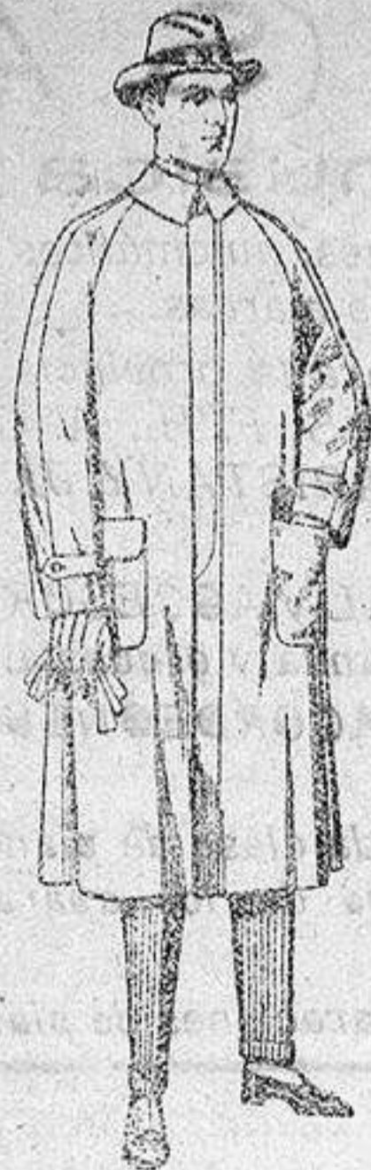
Impermeables, forma gabán, «Reglón», de pesetas 40 a 150

SUCURSALES: Madrid, Barcelona, Almería, Bilbao, Cádiz, Cartagena, Gijón, Granada, Málaga, Palma de Mallorca, Santander, Sevilla, Valencia, Valladolid y Zaragoza.