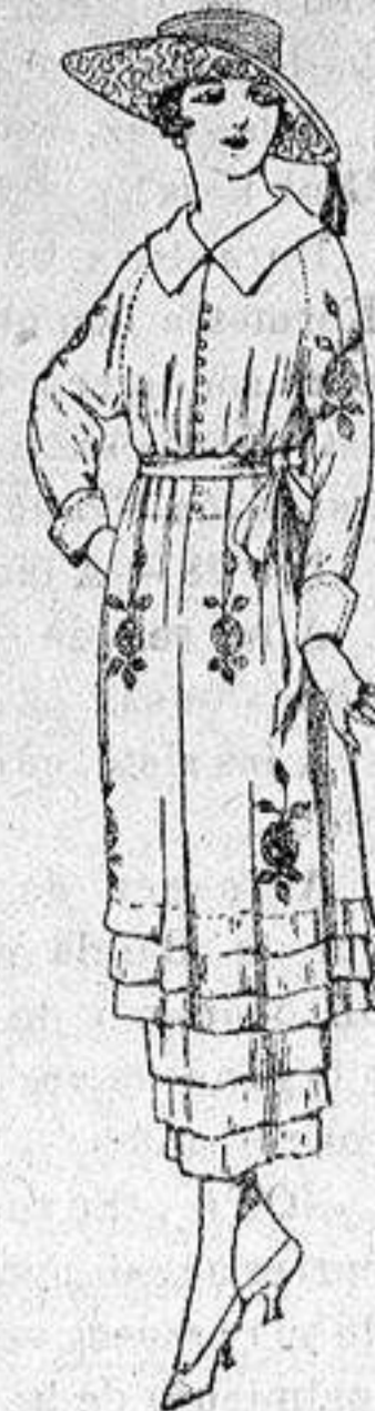
Vestidos de etamin blanco, azul y color, adornos bordados, de ptas 50 a 68.