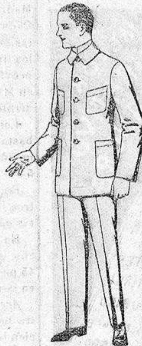
Trajes de dril azul, para mecánicos, de ptas. 17 a 25.

Gamisería, Géneros de punto, Corbatería, Guantería, Sombrerería, Zapatería, Paraguas, Bastones y artículos de viaje