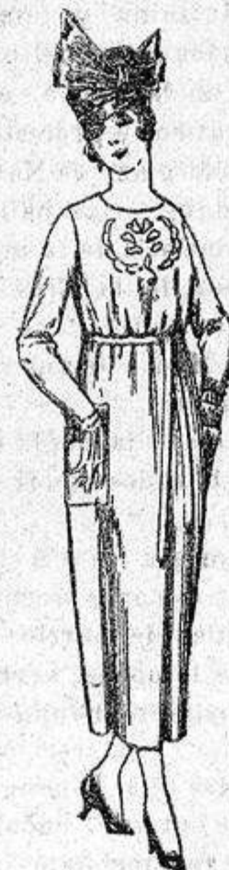
Vestidos de tricot de lana, en azul y colores, bordados a mano, a pesetas 112.

PRECIO FIJO - Pídase el catálogo general