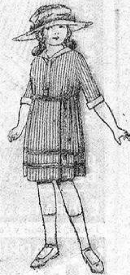
Vestidos de voile, listados, adornos blancos, para niñas de 4 a 9 años, de ptas. 22 a 32.

Gamisería, Géneros de punto, Corbatería, Guantería, Sombrerería, Zapatería, Paraguas, Bastones y artículos de viaje