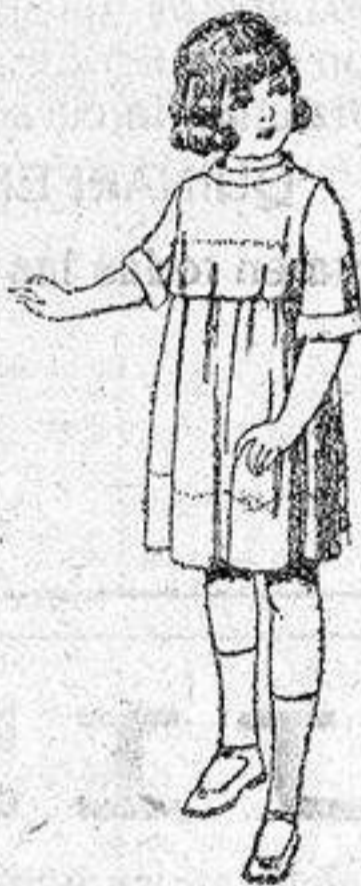
Vestidos de seda liberty, pongés, etc., para niñas de 7 a 12 años, de pesetas 30 a 38.