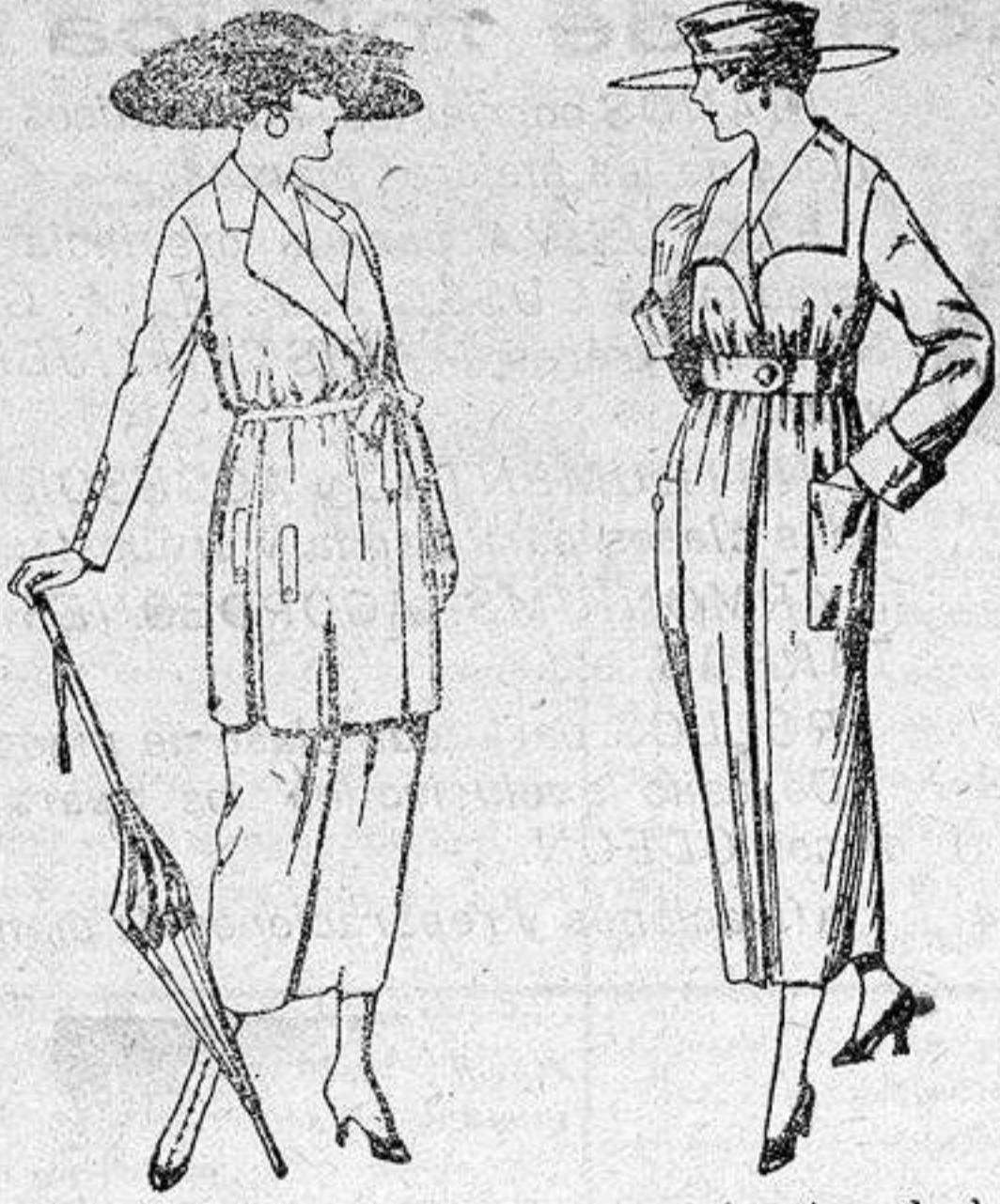
Trajes de estambre, lanilla, etc., en negro, azul y color, de ptas. 120 a 185.