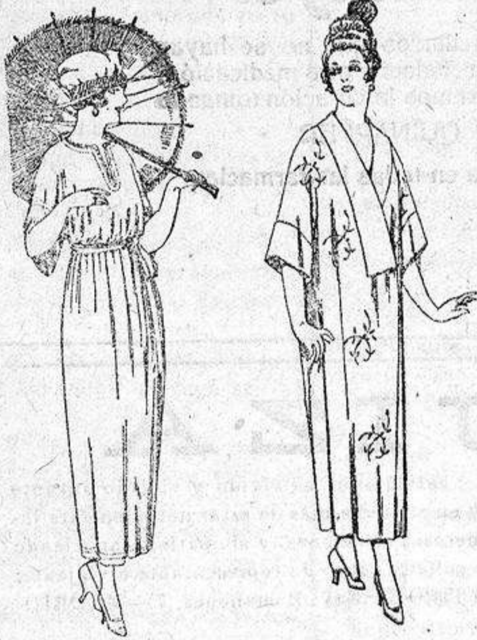
Vestidos de voile blanco y color, adornos bordados, de pesetas 45 a 58.