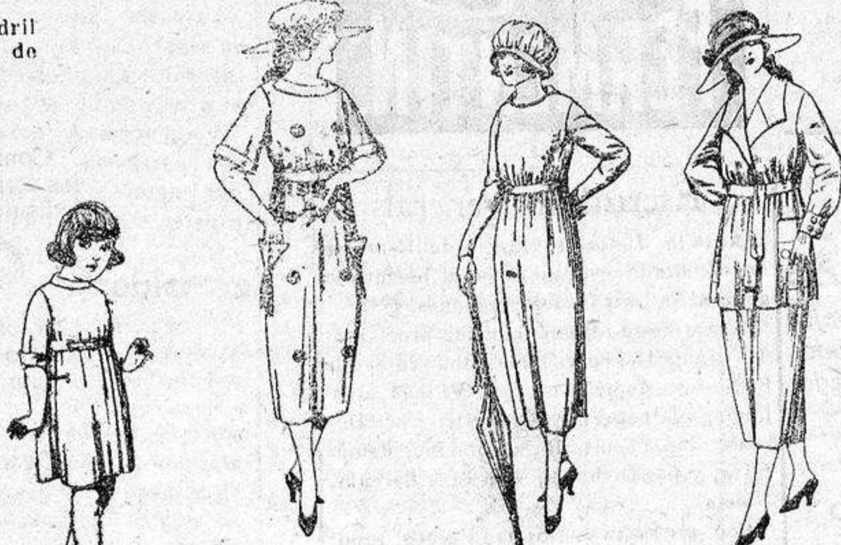
Vestidos de sarga inglesa, estambre, etc., en azul y colores, adornos bordados, de ptas. 55 a 62.