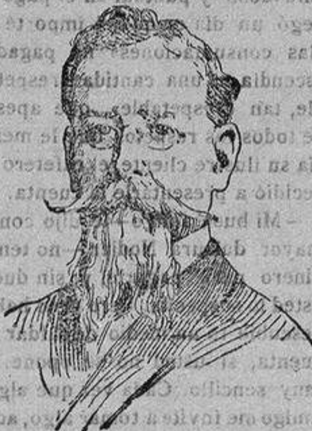
EL GENERAL CARRANZA presidente de México que ha sido asesinado por los revolucionarios en el Estado de Hidalgo