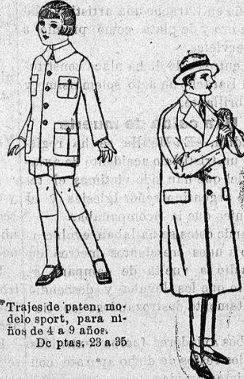
Trajes de patén, modelo sport, para niños de 4 a 9 años. De ptas. 28 a 35

Camisería, Géneros de punto, Corbatería Guantería, Sombrerería, Zapatería, Paraguas, Bastones y artículos de viaje