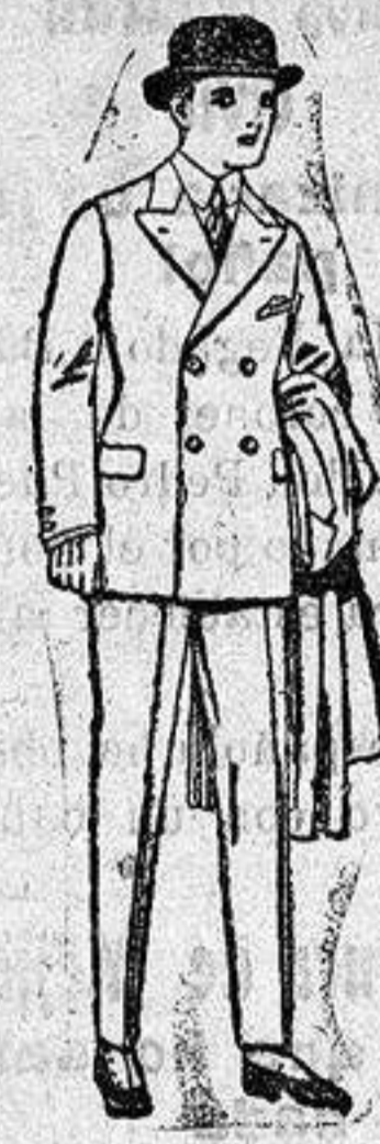
Trajes de patén, y vicuña etc. para niños y jovencitos de diez a dieciséis años. De ptas. 32 a 65

ULTIMA NOVEDAD en echarpes, manguitos, pelerinas, corbatas, abrigos etc. en pieles de lontre, taupe, visión renard, zibelina, armino, etcétera auténticos e imitación perfecta.