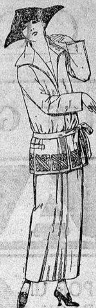
Trajes sastré, de gabardina, sarga inglesa etc., adornos bordados en negro azul y colores moda. a ptas. 115.