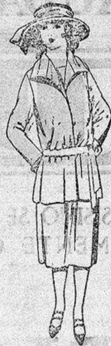
Trajes sastré de gabardina, sarga inglesa etc. en azul y color para jovencitas de 13 a 15 años.