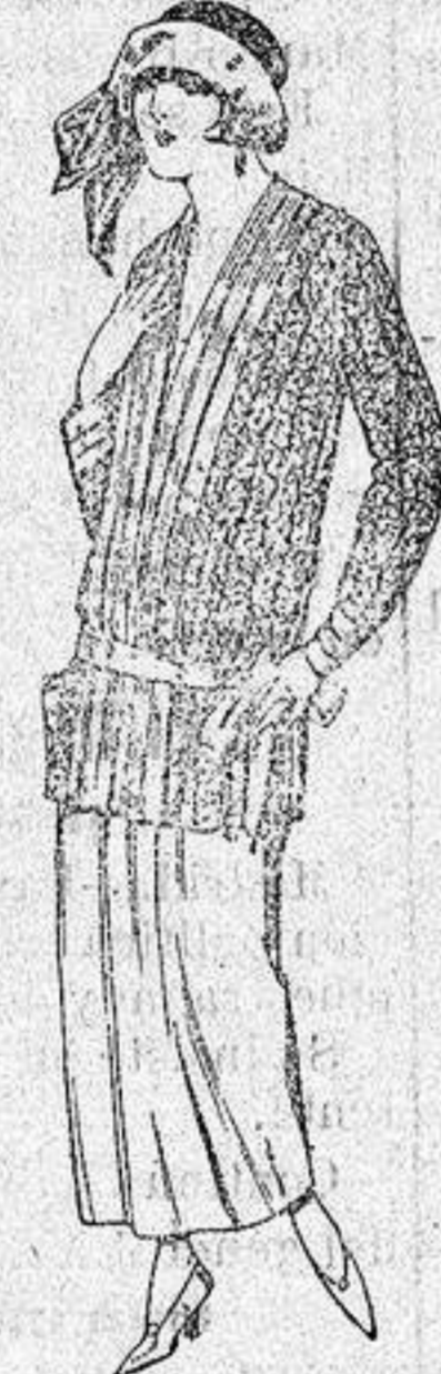
Paletots de punto de seda, dibujos novedad. a ptas. 90.