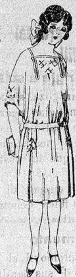
Vestidos de popeline, estambre, etc. en azul y colores moda adornos bordados para jovencitas de 13 a 15 años. a ptas. 60