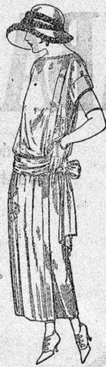
Vestidos de tricote de seda, en negro, azul y colores moda, adornos bordados a mano. a ptas. 125.