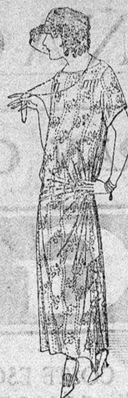
Vestidos de voile, dibujos moda, adornos plizados, broches fantasía. a ptas. 62.