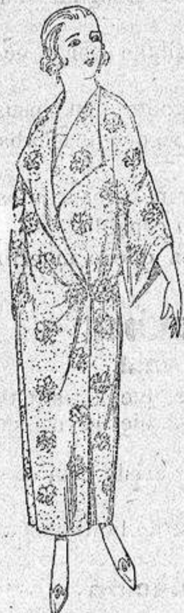
Batas de crespón estampado broche de adorno. a pesetas 25