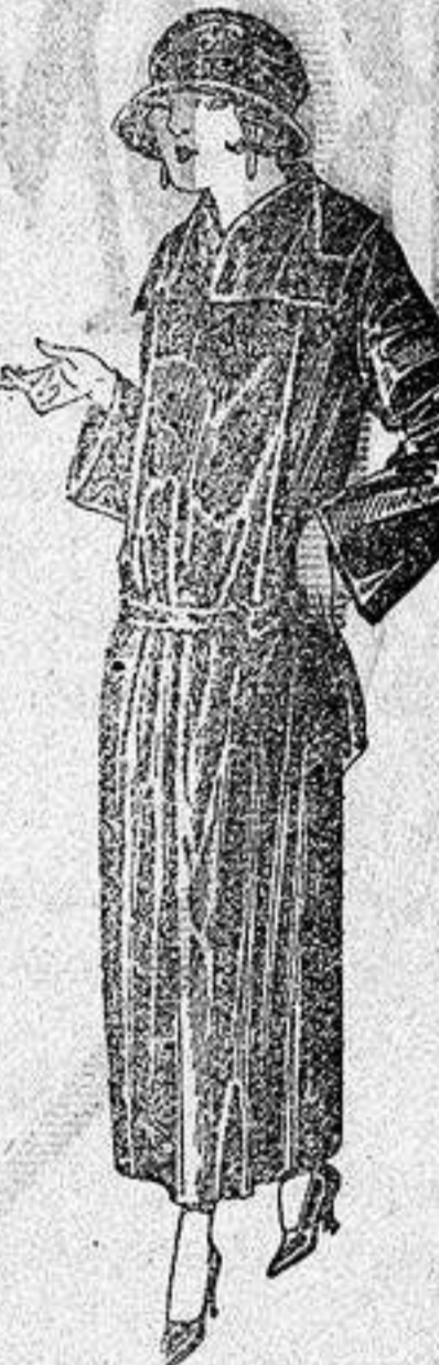
Abrigos de gabardina, impermeabilizada, en negro azul y color. a ptas. 130