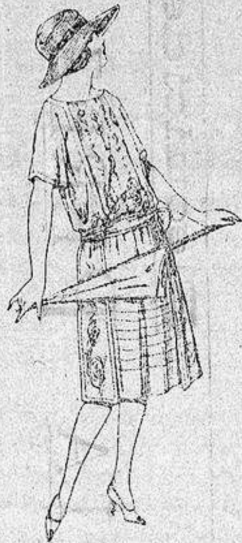
Vestidos de voile, adornos bordados para jovencitas de 13 a 15 años. a ptas. 40.