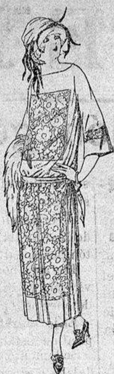
Vestidos de popeline crespón etc., en negro azul y color, adornos bordados. a ptas. 130