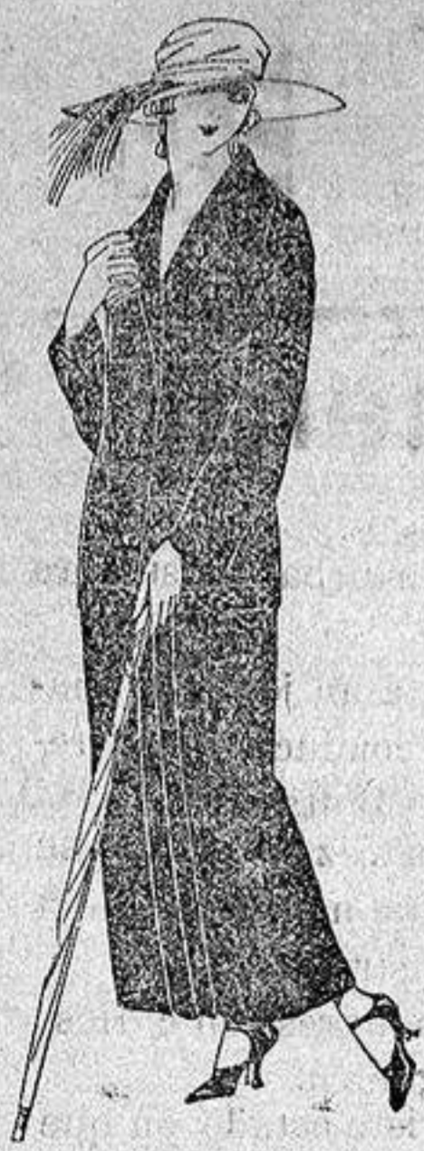
Trajes sastré, de sarga inglesa, popeline, etc., adornos bordados chaqueta forrada de seda, en negro, azul y colores moda. de ptas. 120 a 135

Altamira, 2 :- Alicante :- Victoria, 1 Sucursales: Madrid, Barcelona, Almeria, Bilbao, Cadiz, Cartagena, Gijón, Granada, Málaga, Palma de Mallorca, Santander, Sevilla, Va- lencia, Valladolid, Zaragoza