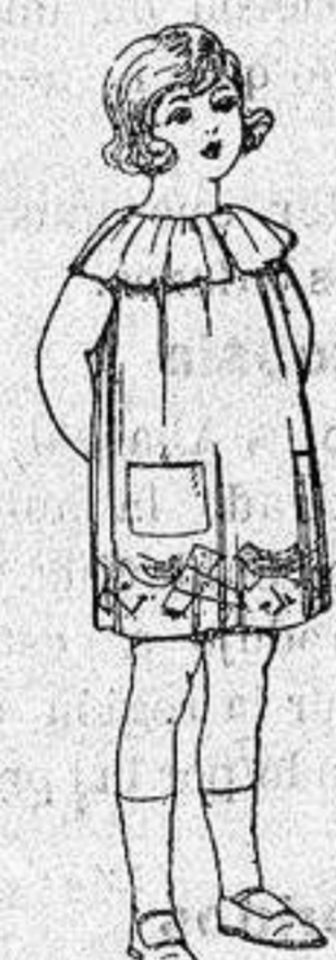
Delantales etc. en colores moda adornos bordados para niños de 5 a 6 años. de ptas. 8'50 a 6'50

Ropas confeccionadas para Caballero, Señora, Niño y Niña