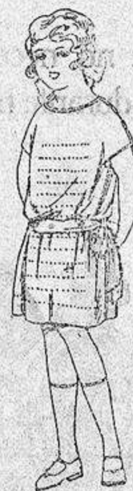
Vestidos voile, adornos calados para niñas de 4 a 6 años. de ptas. 15 a 18.

Boas, Camisería, Géneros de punto Corbatería, Guantería, Sombrerería Zapatería, Paraguas Bastones y Sombrillas