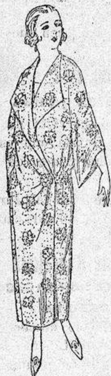
Batas de crespón estampa- do broche de adorno. a pesetas 25