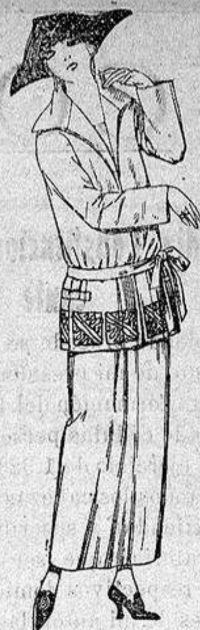
Trajes sastré, de gaba- dina, sarga inglesa etc., adornos bordados en ne- gro azul y colores moda. a ptas. 115.