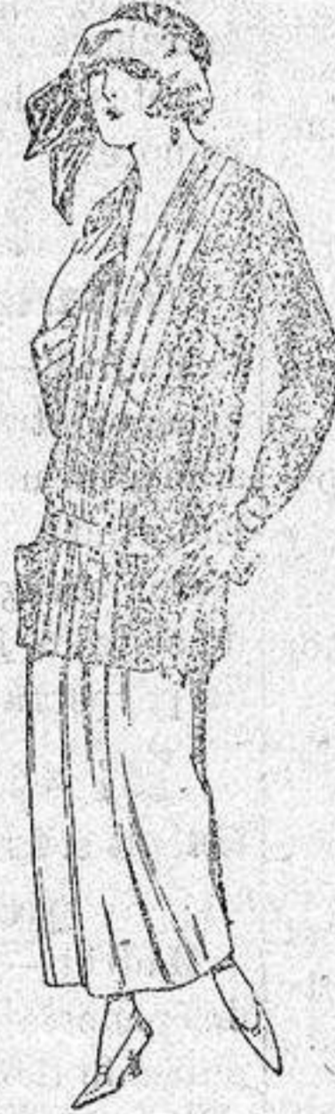
Paletots de punto de seda, dibujos novedad. a ptas. 90.