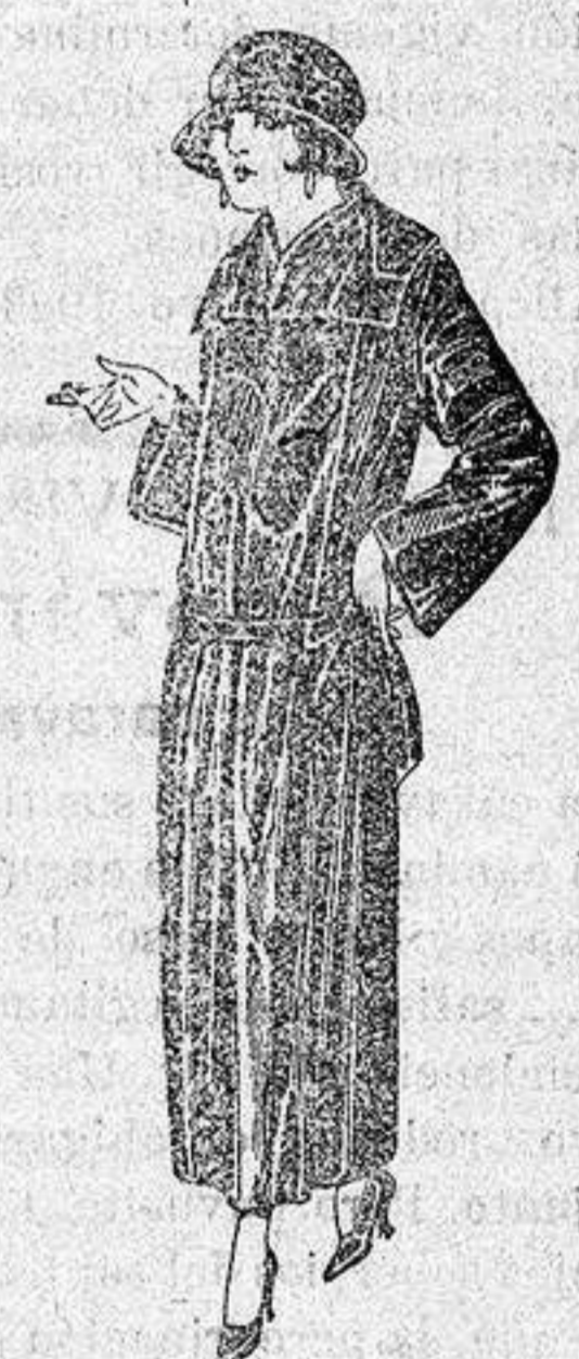
Abrigos de gabardina, in- glesa impermeabilizada, en negro azul y color. a ptas. 130