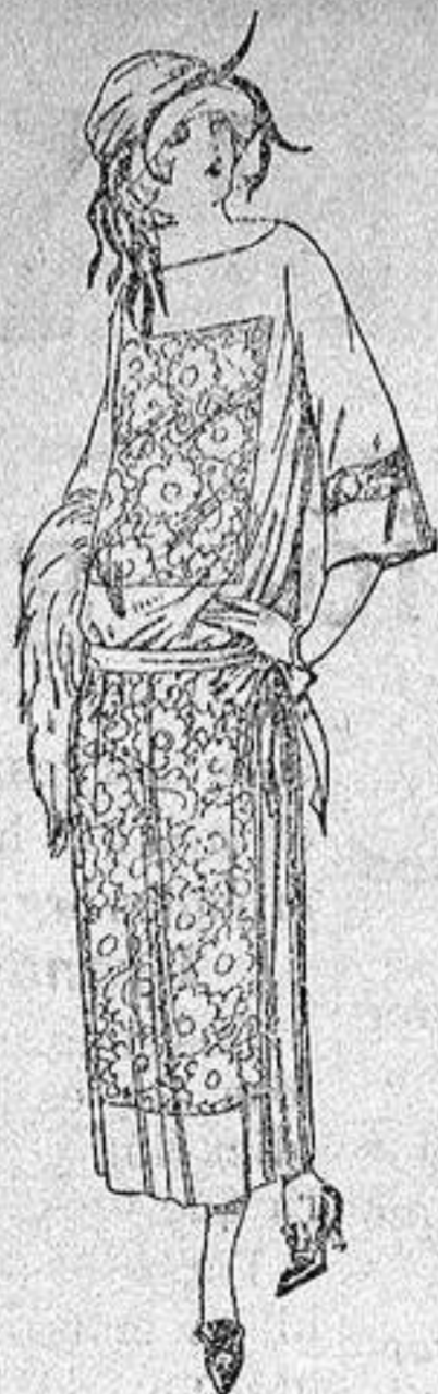
Vestidos de popeline crespón etc., en negro azul y color, adornos bordados. a ptas. 130