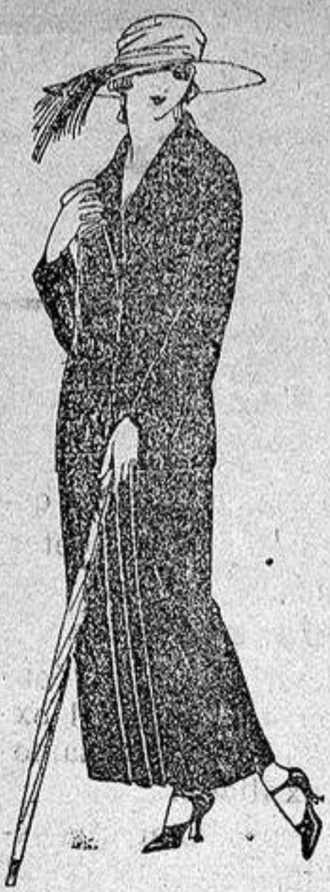
Trajes sastré, de sarga in- glesa, popeline, etc., ad- ornos bordados, chaqueta fo- rrada de seda, en negro, azul y colores moda de ptas. 120 a 135

Altamira, 2 :: Alicante :: Victoria, 1 Sucursales: Madrid, Barcelona, Almeria, Bilbao, Cadiz, Cartagena, Gijón, Granada, Málaga, Palma de Mallorca, Santander, Sevilla, Va- lencia, Valladolid, Zaragoza