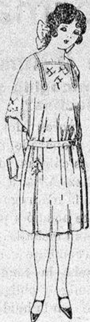
Vestidos de popeline, estambre, etc. en azul y colores moda adornos bordados para jovenci- tas de 13 a 15 años a ptas. 60