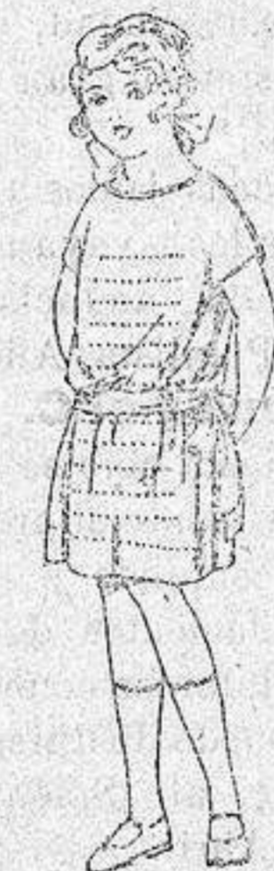
Vestidos voile, ad- ornos bordados para niñas de 4 a 6 años. de ptas. 15 a 18.

Boas, Camisería, Géneros de punto Corbate- ria, Guantería, Sombrerería Zapatería, Para- guas Bastones y Sombrillas