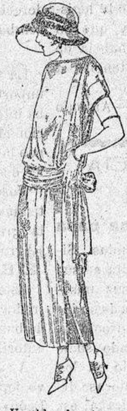
Vestidos de tricot de seda, en negro, azul y colores moda, adornos bordados a mano. a ptas. 125.