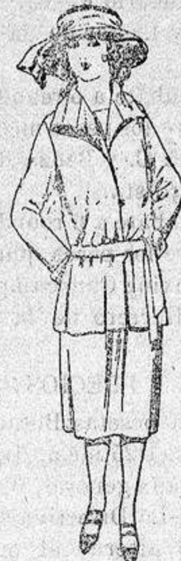
Trajes sastré de gaba- dina, sarga inglesa ect. en azul y color para jovencitas de 13 a 15 años.