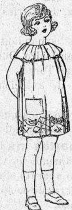
Delantales et min co- lores moda adornos bordados para niños de 5 a 6 años de ptas. 8'50 a 6 50

Ropas confeccionadas para Caballero, Se- ñora, Niño y Niña