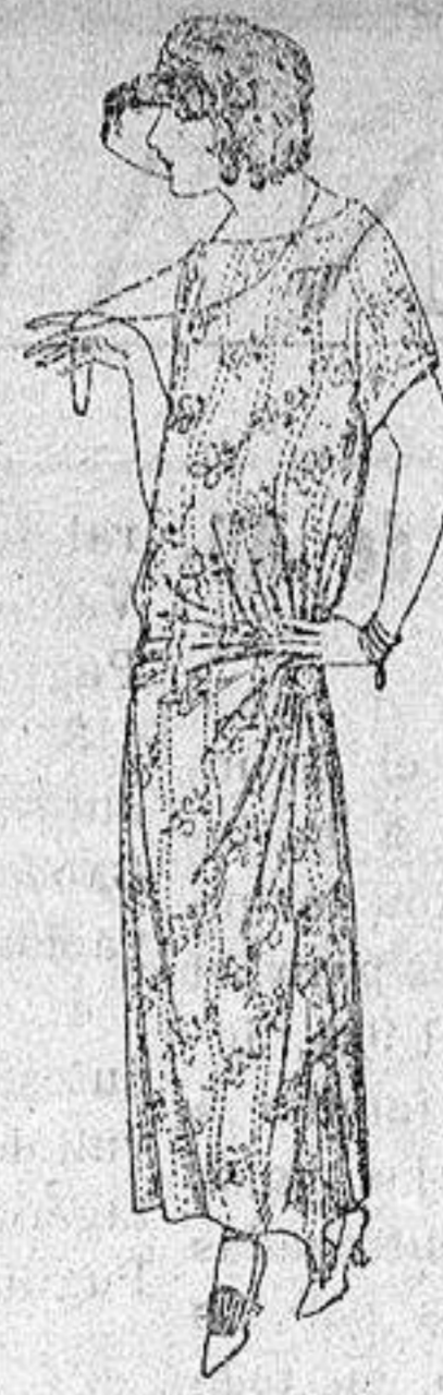
Vestidos de voile, di- bujos moda, adornos plizados, broches fan- tasía. a ptas. 62.