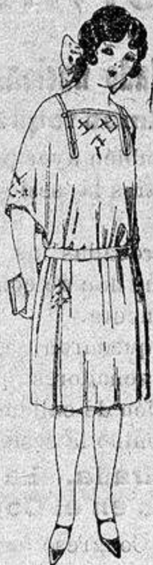
Vestidos de popeline, estambre, etc., en azul y colores moda adornos bordados para jovencitas de 13 a 15 años a ptas. 60