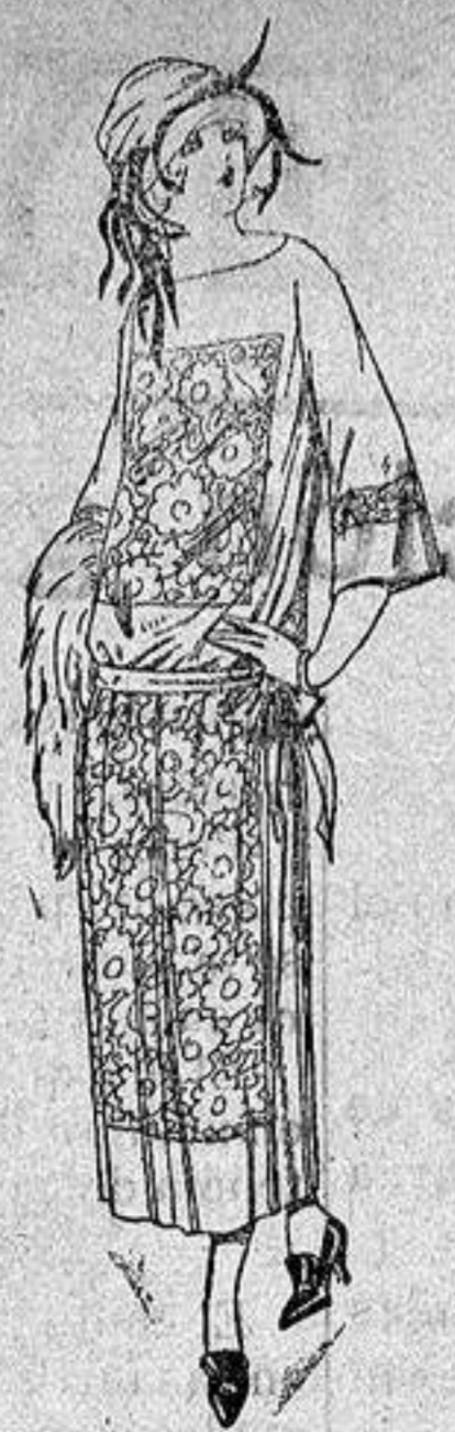
Vestidos de popeline, estambre, etc., en negro azul y color, adornos bordados a ptas. 130