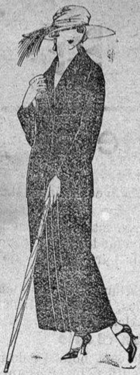
Trajes sastre, de sarga inglesa, popeline, etc., adornos bordados, chaqueta forrada de seda, en negro, azul y colores moda a ptas. 120 a 135

Sucursales: Madrid, Barcelona, Almeria, Bilbao, Cadiz, Cartagena, Gijón, Granada, Málaga, Palma de Mallorca, Santander, Sevilla, Valencia, Valladolid, Zaragoza