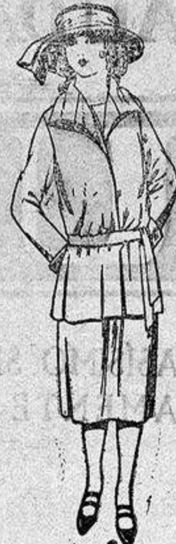
Trajes sastre de gabardina, sarga inglesa etc., en azul y color para jovencitas de 13 a 15 años.