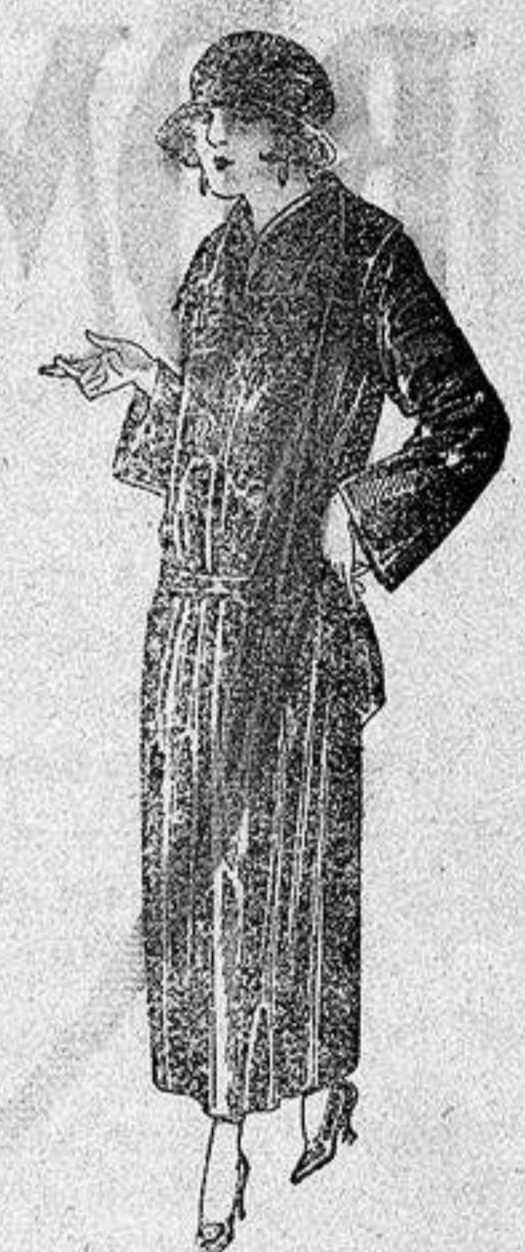
Abrigos de gabardina, inglesa impermeabilizada, en negro azul y color a ptas. 130