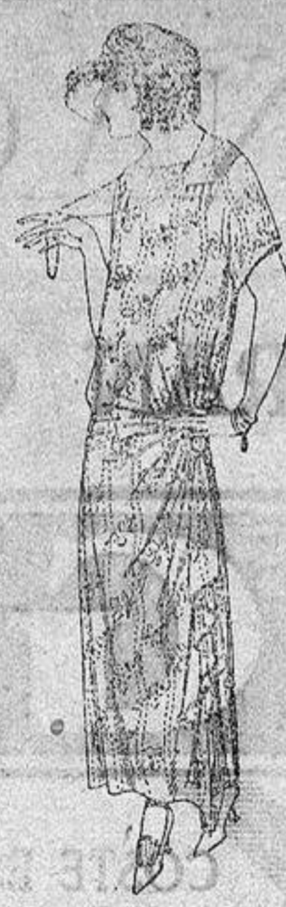
Vestidos de voile, dibujos moda, adornos plizados, broches fantasía a ptas. 62.