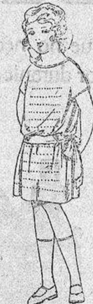
Vestidos voile, adornos calados para niñas de 4 a 6 años de ptas. 15 a 18.

Boas, Camisería, Géneros de punto Corbatería, Guantería, Sombrerería Zapatería, Paraguas Bastones y Sombrillas