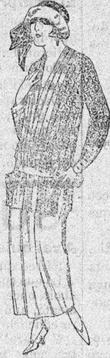
Paletots de punto de seda, dibujos novedad a ptas. 90.