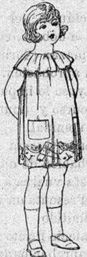
Delantales etn. en colores moda, adornos bordados para niños de 5 a 6 años de ptas. 8'50 a 6'50

Ropas confeccionadas para Caballero, Señora, Niño y Niña