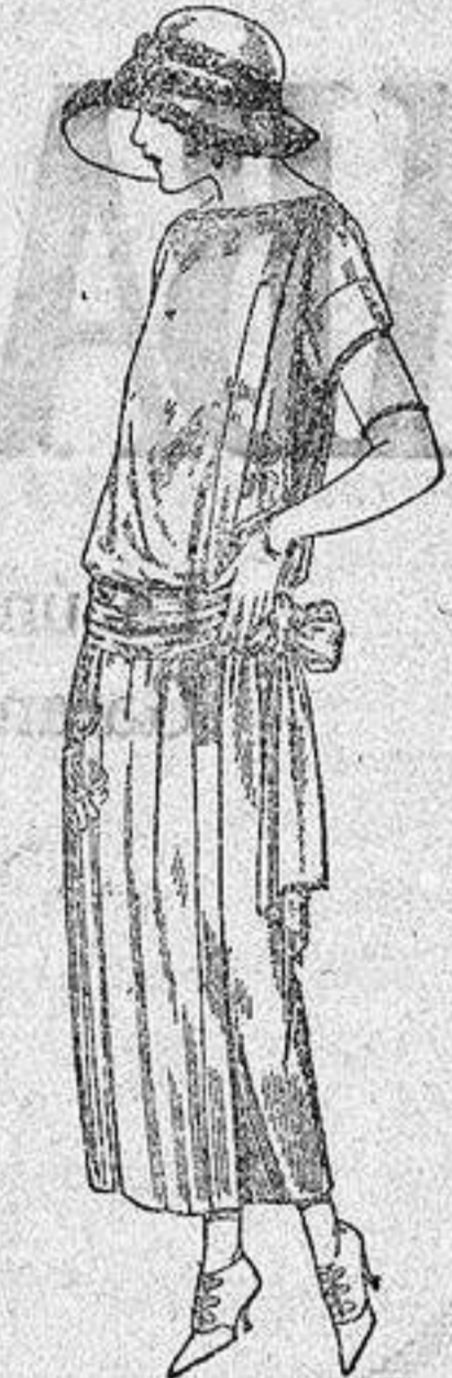
Vestidos de tricot de seda, en negro, azul y colores moda, adornos bordados a mano a ptas. 125.