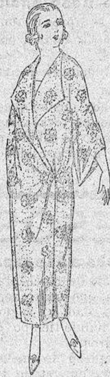
Batas de crepón estampado broche de adorno a pesetas 25