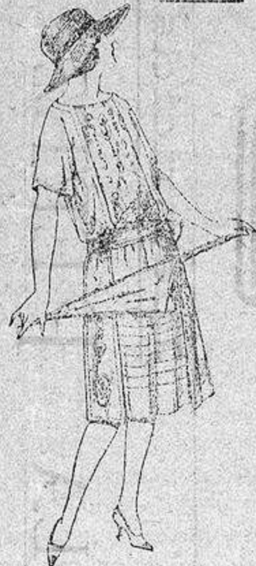
Vestidos de voile, adornos bordados para jovencitas de 13 a 15 años a ptas. 40