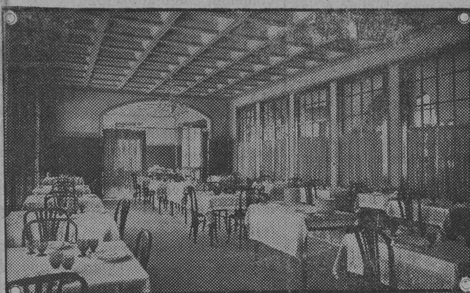
Detalle del comedor del "Hotel Monumental"