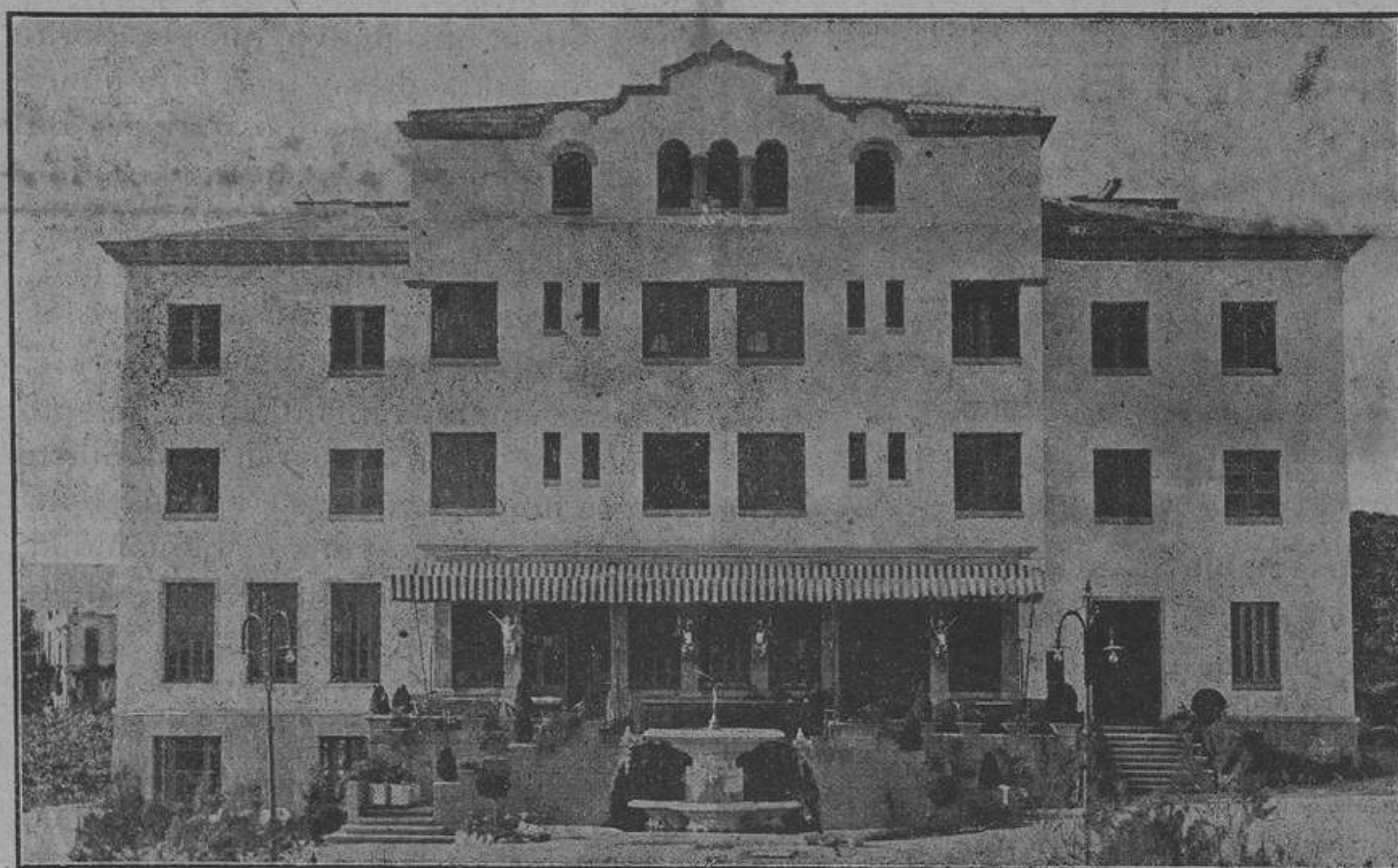
Fachada principal del gran "Hotel Monumental S'Agaró"