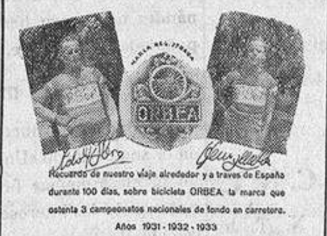
Recuerdo de nuestro viaje alrededor y a través de España durante 100 días, sobre bicicleta ORBEA. La marca que ostenta 3 componentes nacionales de fondo en carretera. Año 1931-1932-1933. Hagan ciclismo, pues es un ejercicio muy saludable, nosotras, fervientes entusiastas, se lo recomendamos y si lo practica nos lo agradecerá. Mantenga su cuerpo joven, ágil y esbulto con el uso adecuado de este que es el más saludable.

Amantes del deporte hubieron de hablarnos de sus excelencias y del bien que reporta al organismo para todos aquellos que lo practican de manera metódica, razón por la que ejercita obligadamente y con predilección en todas las escuelas donde se atiende debidamente como aconsejan los métodos pedagógicos, ateniéndose a sus excelentes resultados, que no son otros que los de vigorizar los organismos haciendo hombres fuertes y útiles.