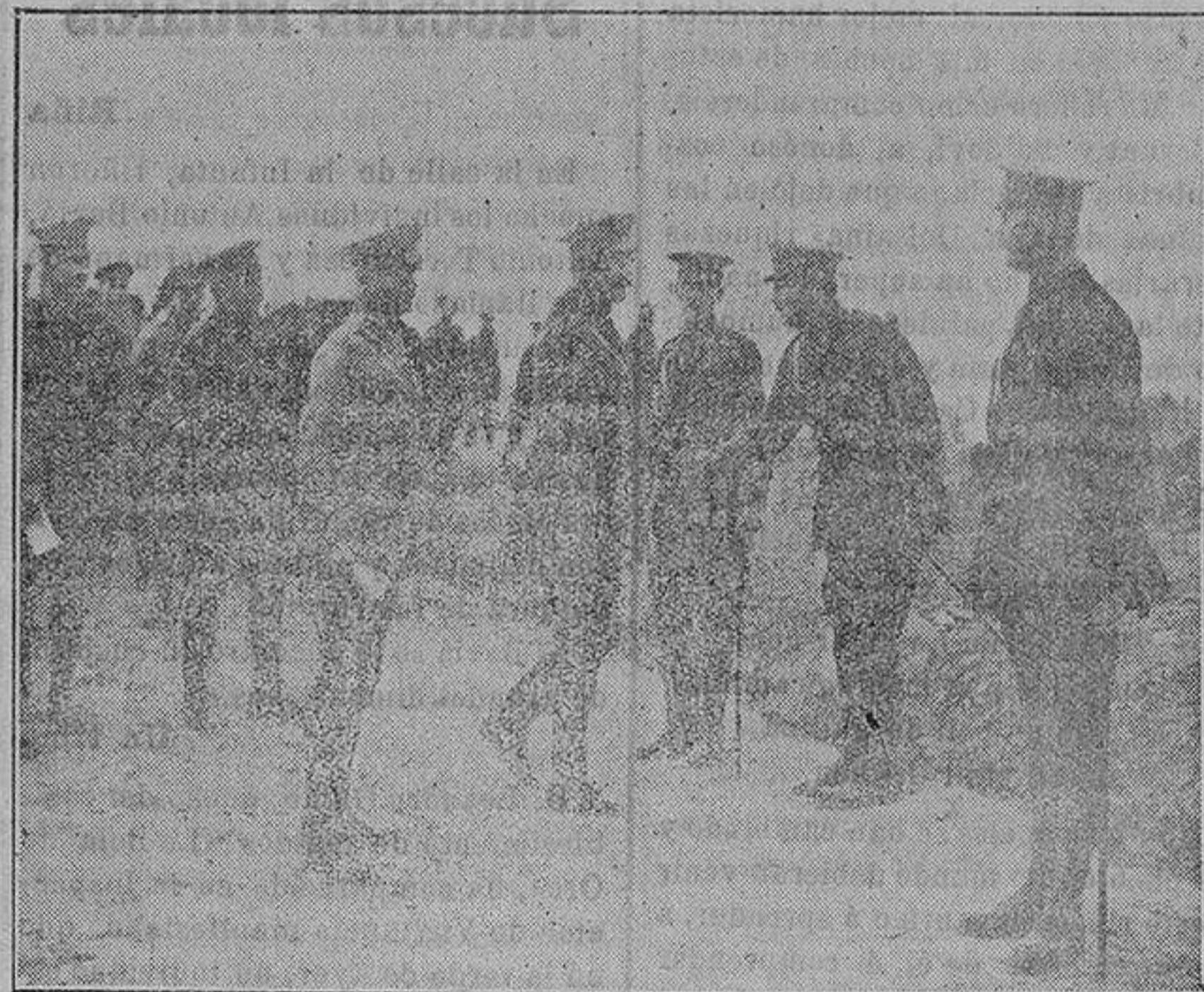
El general Douglas felicitando á los jefes ingleses