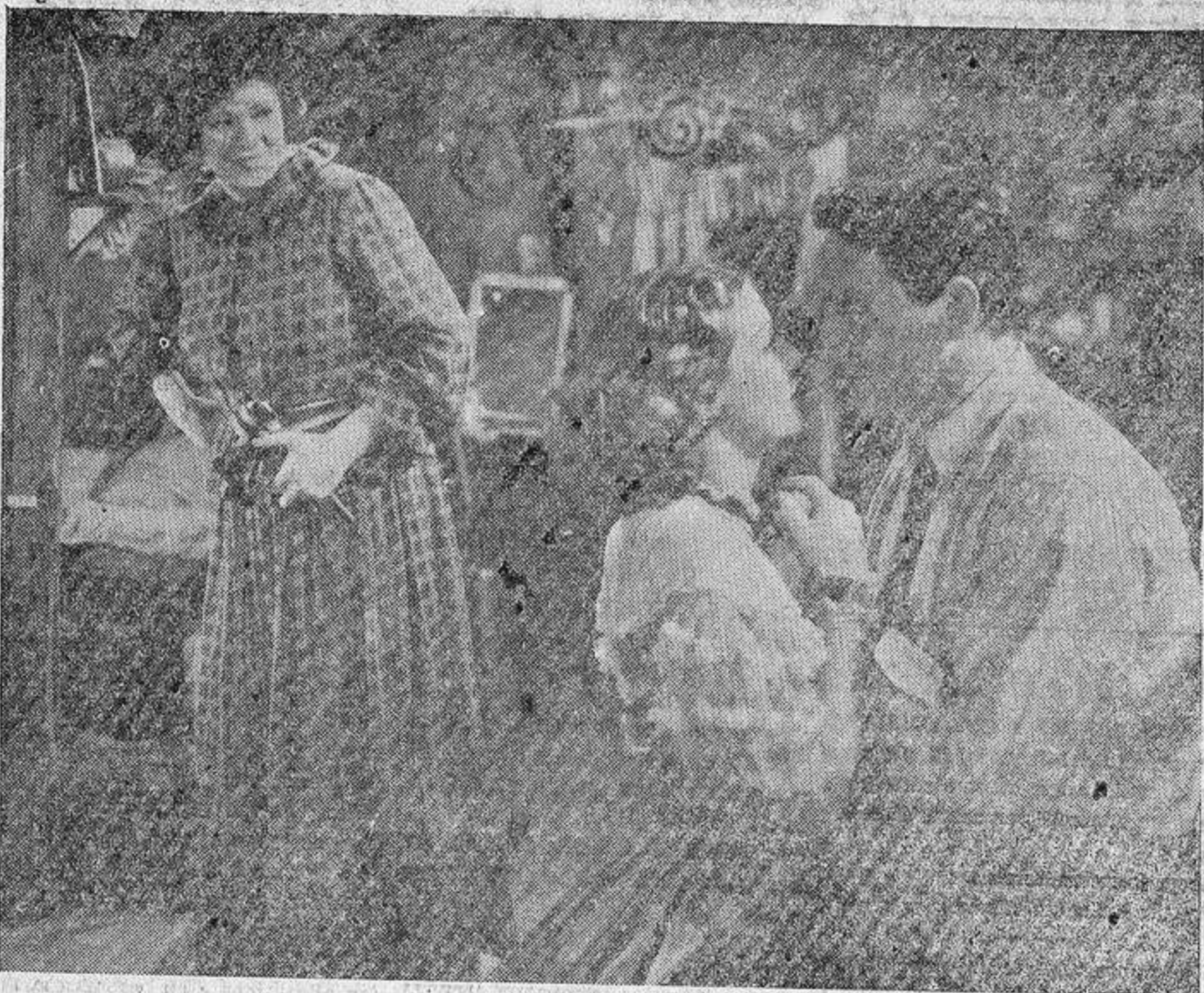
Una interesante escena del film Columbia hablado en español «Fueros humanos» que distribuye la prestigiosa actuaría valenciana CIFESA

Para la generalidad de estos directores, el «cine» no descubre ningún interés «introspectivo» —o por decirlo así—, sino extenso y externo: su horizonte es el mundo objetivo —que está fuera del asunto y de los actores—, circundante, expansivo; no, la intimidad subjetiva, que vive en sí misma y tan solo necesita para articularse el marco externo y circunstancial del mundo ob-