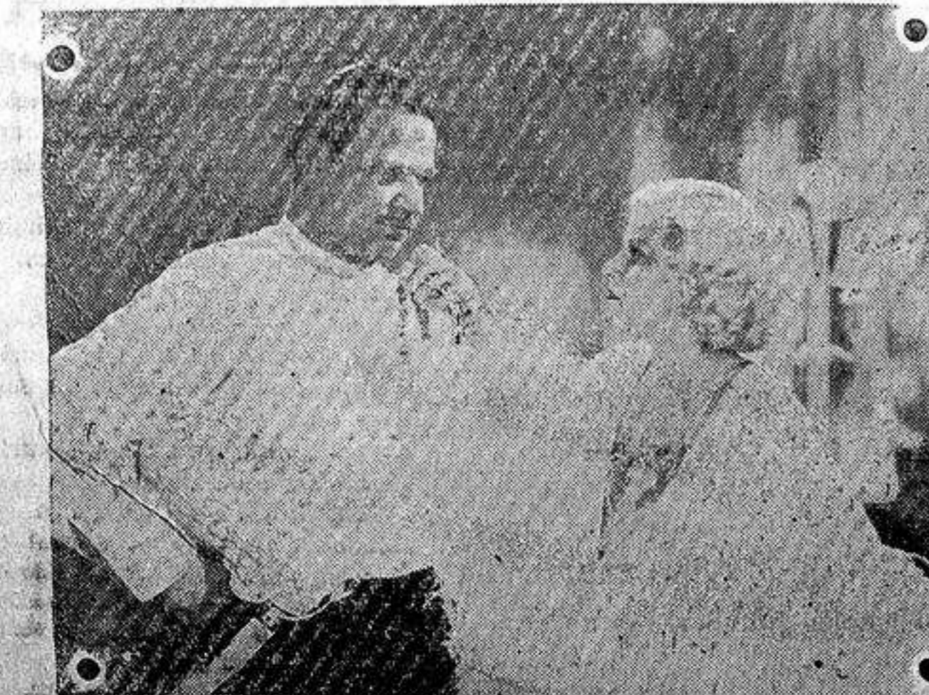
Wallace Beery y Jean Harlow

¿Por qué, entonces, teniendo estas posibilidades el film de dibujos animales, —Koko, Félix El Gato, Mickey, el conejo Blas, Betty, etc.— dando con ello una contienda anecdótica a esos films, y sin embargo, a pesar de