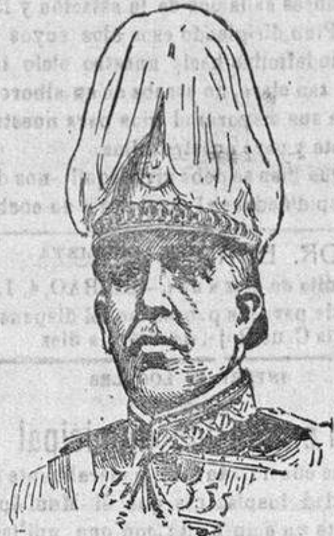
General Aguilá Jefe de la brigada de Cazadores, fallecido en Melilla