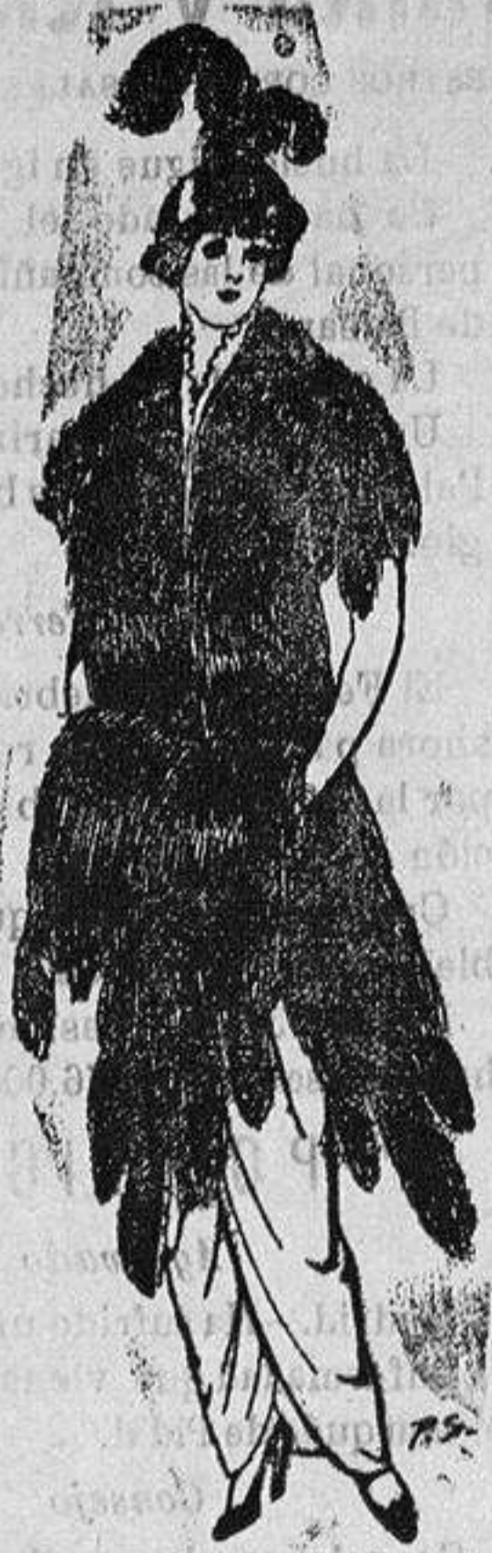
Juego de pieles imitación de Renard negro. De Ptas. 43 a 75