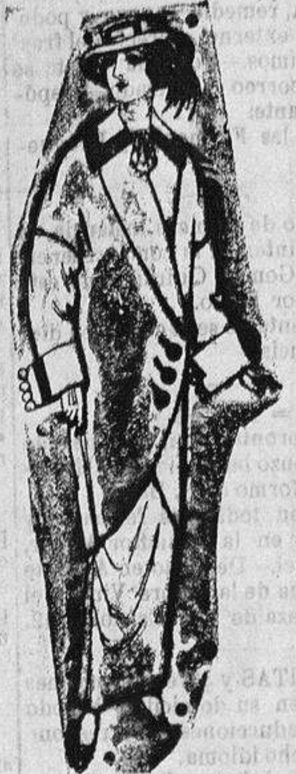
Abrigos de patén para señora De ptas. 5 a 65