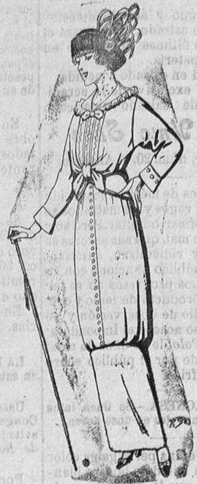
Vestido de lanilla negra o azul para señora a Ptas. 52

Ropas confeccionadas para Caballeros y Niño y Artículos de la Temporada