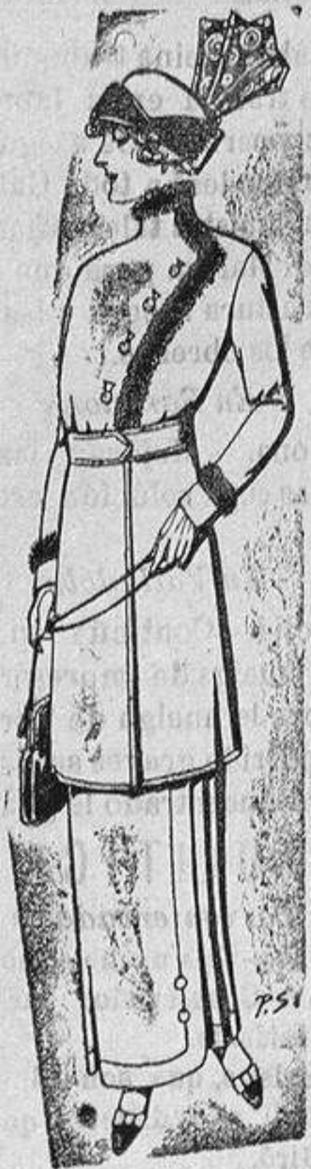
Trajes de lana o cheviot para señora a Ptas. 53 y 55

Madrid, Barcelona, Almeria, Bilbao, Cádiz, Cartagena, Gijón, Granada, Málaga, Palma de Mallorca, Santander, Sevilla, Valencia, Valladolid y Zaragoza.