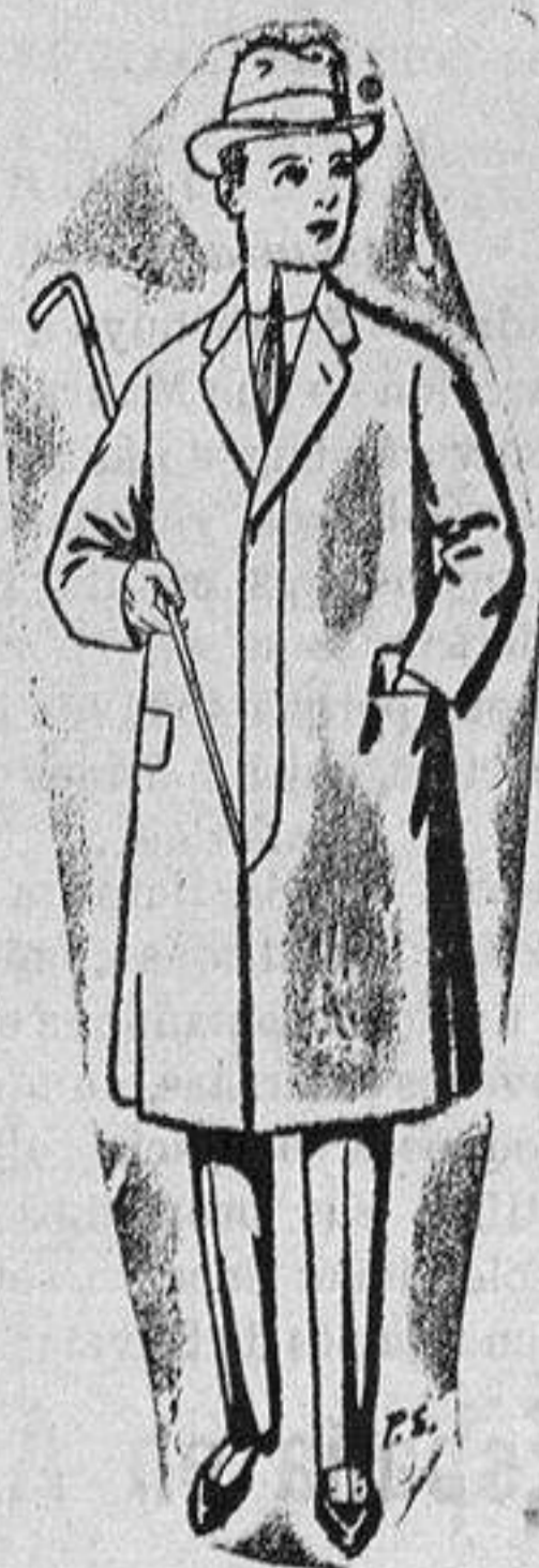
Gabanes de lana para jovencitos de 10 a 16 años De ptas. 14 a 50