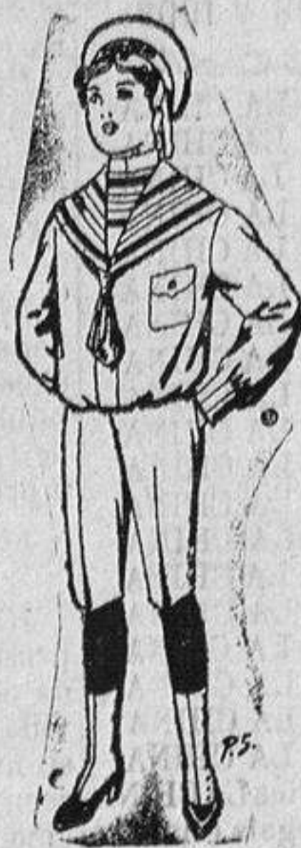
Trajes de jerga, azul o negro para niños de 4 a 9 años De ptas. 10 a 26

Madrid, Barcelona, Almeria, Bilbao, Cádiz, Cartagena, Gijón, Granada, Málaga, Palma de Mallorca, Santander, Sevilla, Valencia, Valladolid y Zaragoza.