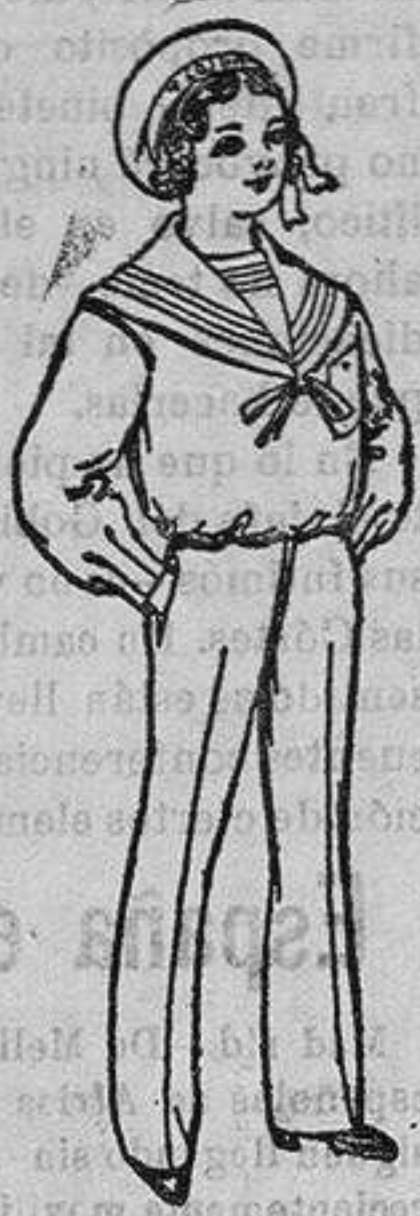
Traje dril blanco para de Pesetas 14 a 24 niño de 4 a 10 años

Ropas confeccionadas para Caballeros y Niño y Artículos de la Temporada