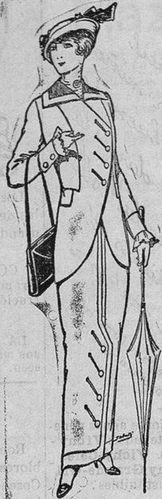
Traje de jerga para señora a Ptas. 22, 30 y 38