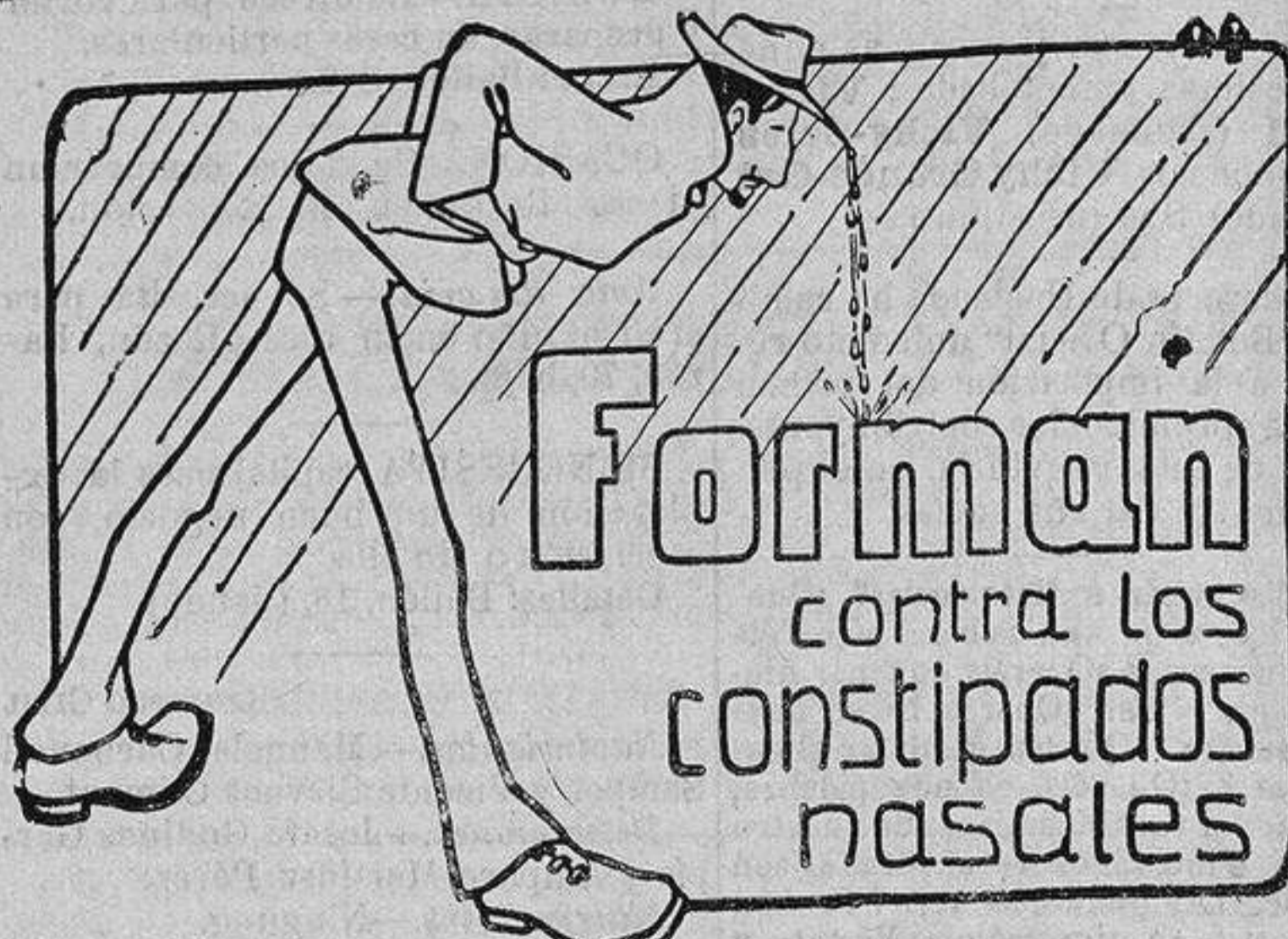
PRECIO DE LA CAJA, 0'75 PESETAS.— De venta en las principales Farmacias y droguerías.

La titulación y pliego de condiciones por el cual se ha de regir la subasta están en poder del indicado notario, y el referido corredor dará más detalles.