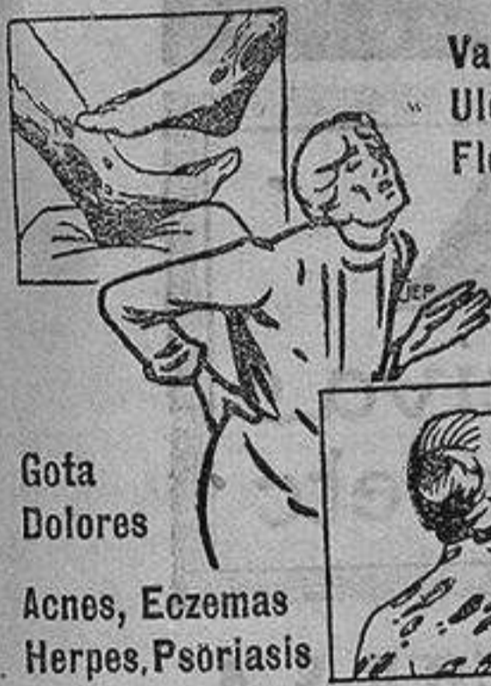
Varios Ulceras Flebitis