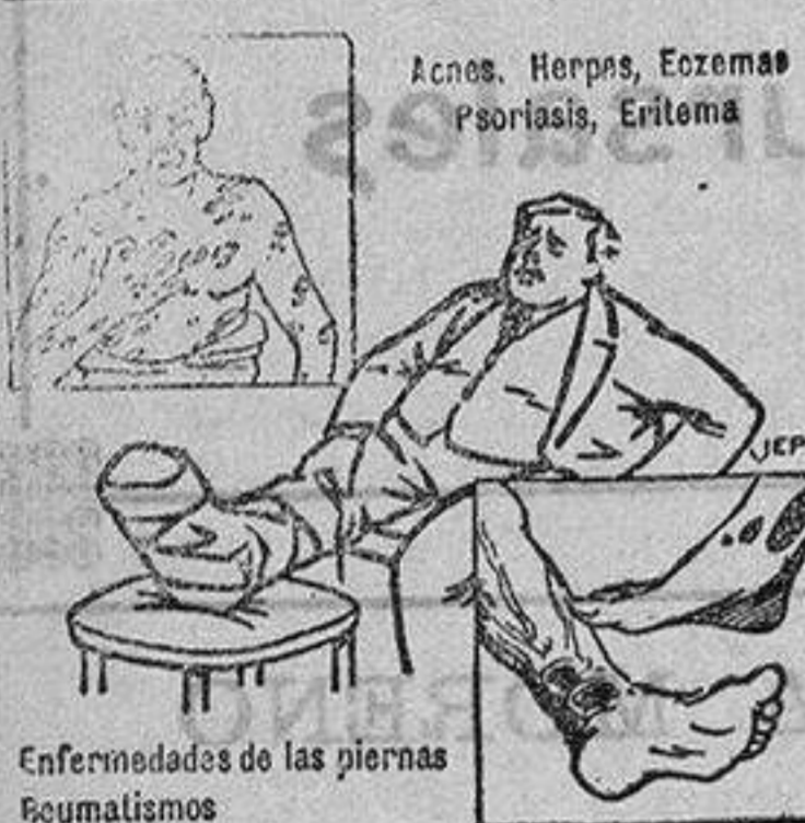
Enfermedades de las piernas. Reumatismos.

Si V. trincha bien los cubitos se disolverán más pronto. El Caldo MAGGI en cubitos se vende en todas las buenas tiendas de ultramarinos y comestibles al precio de diez céntimos por cubito.