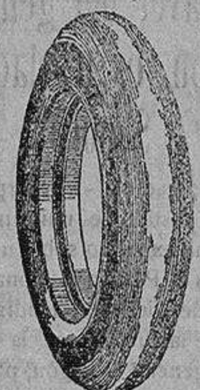
La cubierta inservible que usted nos entrega

las cubiertas viejas de su automóvil. Aunque estén inútiles e inservibles se las dejaremos nuevas