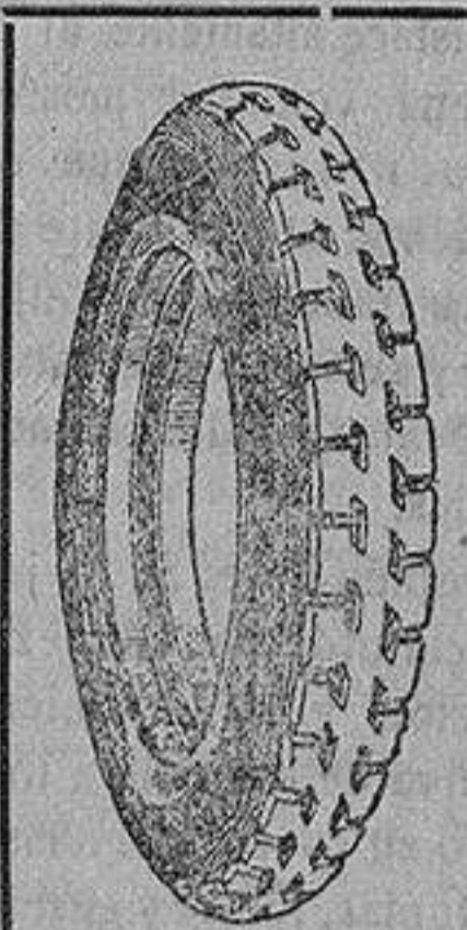
La cubierta recauchutada que le devuelve la fábrica.

que si usted adquiriera una cubierta nueva le dejaremos la que nos entregue rota para recorrer 20.000 kilómetros más.