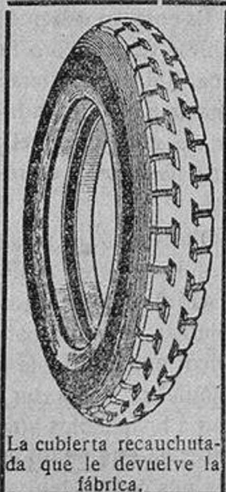
La cubierta recauchutada que le devuelve la fábrica.

que si usted adquiriera una cubierta nueva le dejaremos la que nos entregue rota para recorrer 20.000 kilómetros más.