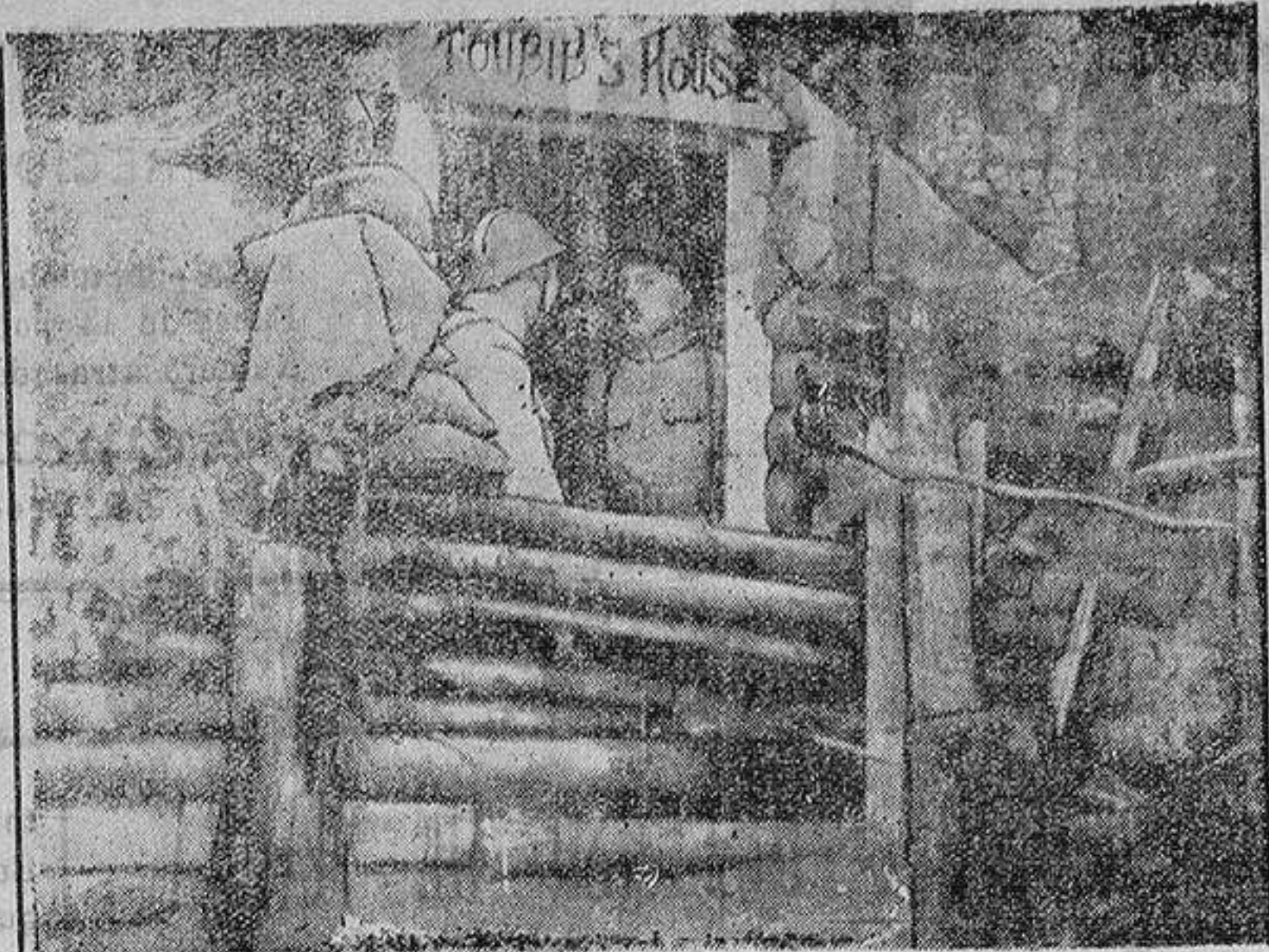
Entrada a un puesto de socorro en primera línea