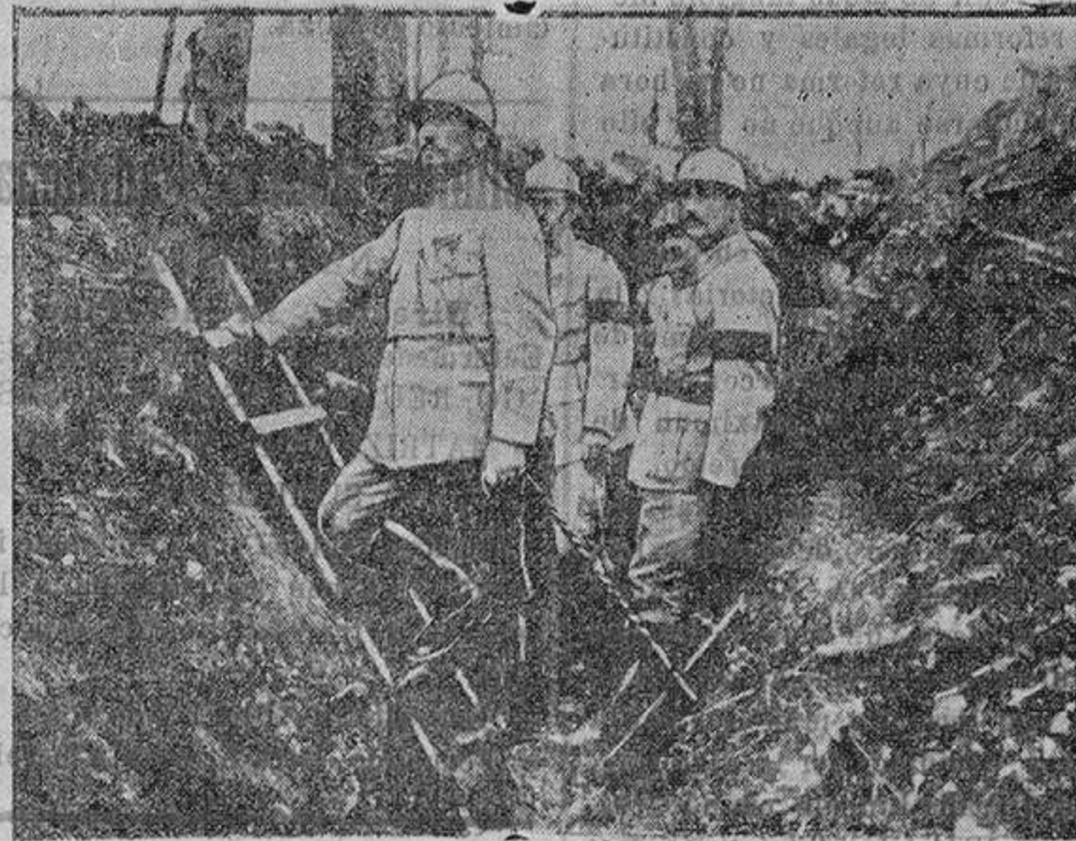
Antes del ataque