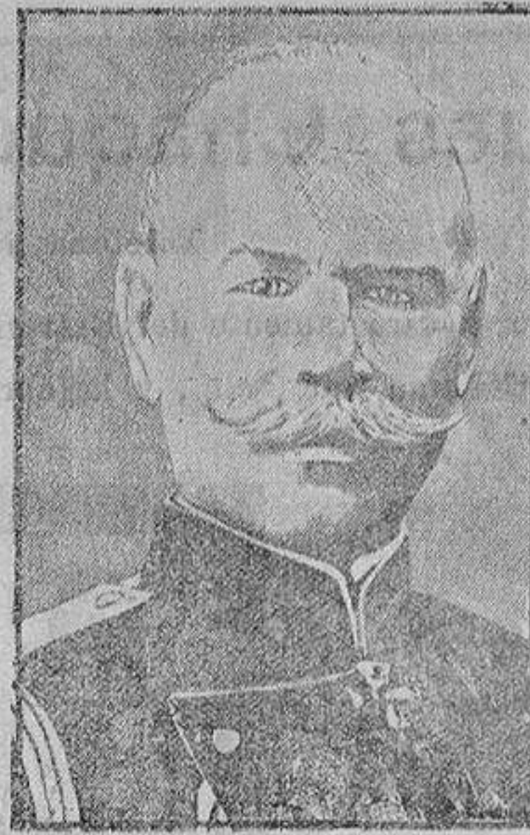
El general ruso Alexeief, virrey que fué de la Manchuria, en la guerra ruso japonesa.

Futuros de Algodon Bolsa y Giro San Fernando, 65, 1.º—Alicante